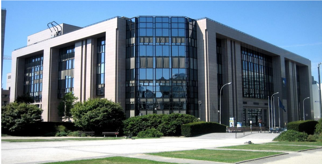
Edificio Justus Lipsius (Consejo)

Subdirección General de Asuntos Sociales, Educativos, Culturales y de Sanidad y Consumo