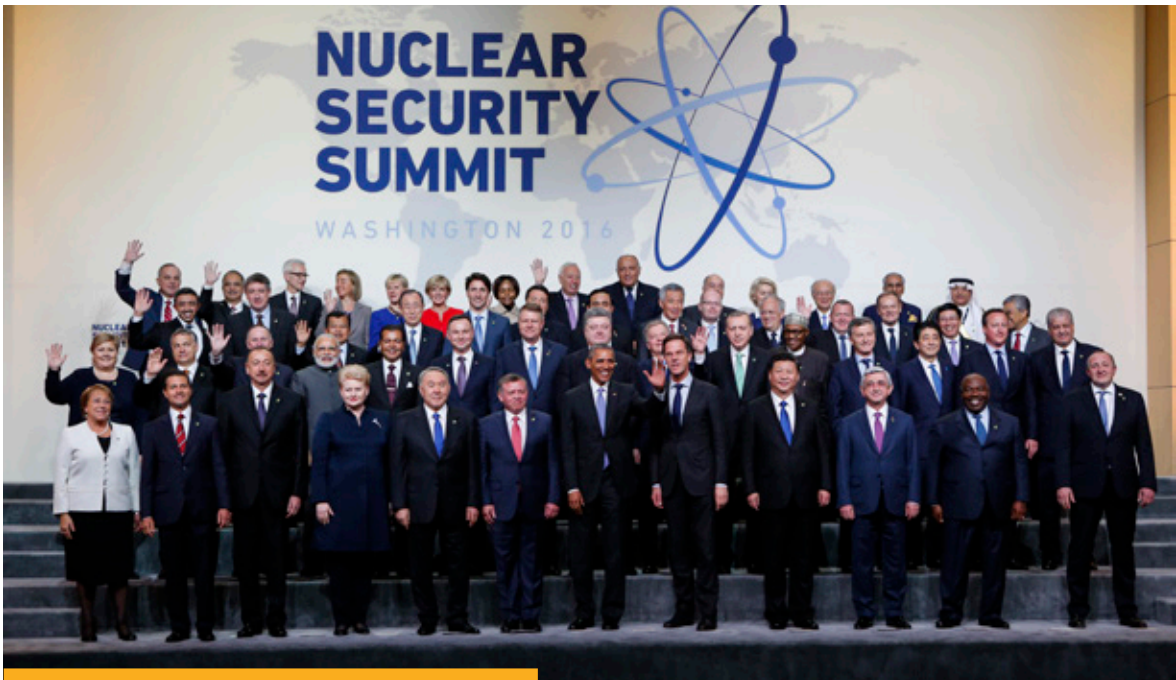
Fotografía de familia de la IV Cumbre de Seguridad Nuclear celebrada en Washington en abril de 2016 y en la que participó España.

y que dota a la Resolución 2325 de una gran legitimidad. El texto recibió igualmente un total de 78 copatrocinios. La Resolución crea unas bases renovadas para los próximos cinco años que refuerzan los mecanismos de prevención del riesgo de posesión y empleo de Armas de Destrucción Masiva por terroristas.