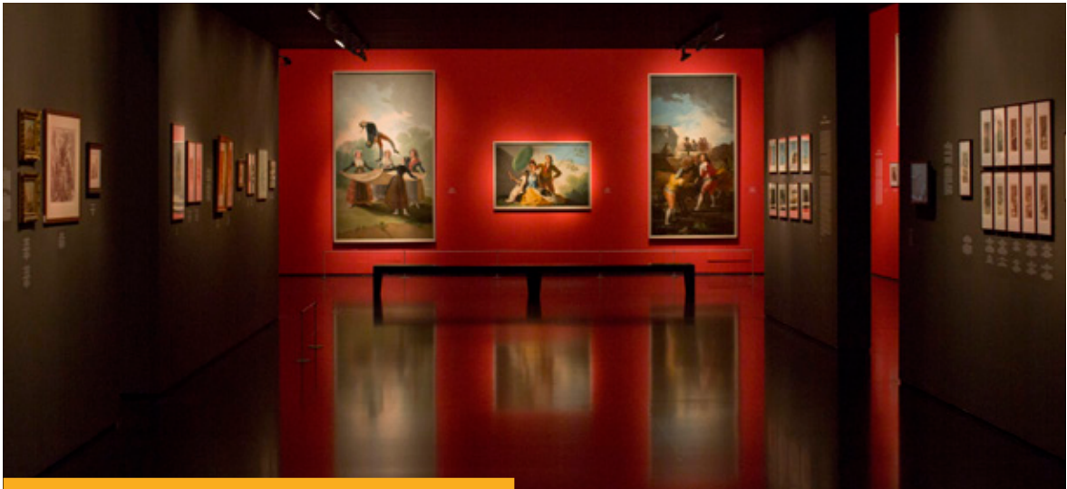
Imagen de la exposición: "Francisco de Goya: Sueños y Pesadillas" compuesta por obras cedidas por el Museo del Prado al Museo de Israel, que puso el broche final al 30 aniversario del restablecimiento de relaciones diplomática entre España e Israel.

frente a la cuestión de las migraciones y los refugiados, o afrontar los retos vinculados a la seguridad global y la amenaza del terrorismo. Por su parte, el actual Ministro de Asuntos Exteriores y de Cooperación se reunió con Abul Gheit con ocasión de su asistencia a la Conferencia Ministerial UE-LEA, celebrada el 20 de diciembre en el Cairo. Los frecuentes contactos muestran el interés por reforzar y dotar de mayor contenido nuestras relaciones con la LEA, llamada a desempeñar un papel creciente en la solución de los múltiples retos en la región.