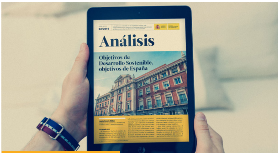
Publicación 'Análisis' realizada por la Oficina de Análisis y Previsión.

mente España es muy activa en la red EUNIC. Por último, España participará en la coordinación e intercambio de buenas prácticas que se produzcan en la UE en el ámbito de la diplomacia pública.