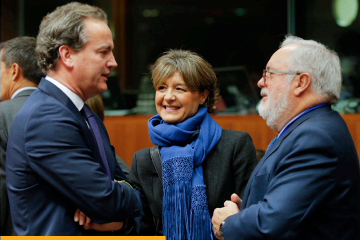
La ministra española de Agricultura y Pesca, Isabel García Tejerina, conversa con el comisario europeo de Cambio Climático y Energía, el español Miguel Arias Cañete, y con el responsable británico de Empresas, Energía y Estrategia Industrial, Nick Hurd, durante una reunión en Bruselas, en diciembre de 2016.

blación, la digitalización social y laboral, y la migración, considerando su impacto en los mercados de trabajo y en la Seguridad Social.