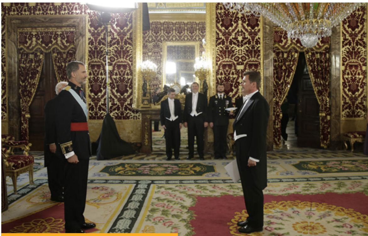
S. M. el Rey recibe las cartas credenciales l embajador de Ucrania, Anatoliy Scherba, en el Palacio Real, en septiembre de 2016.