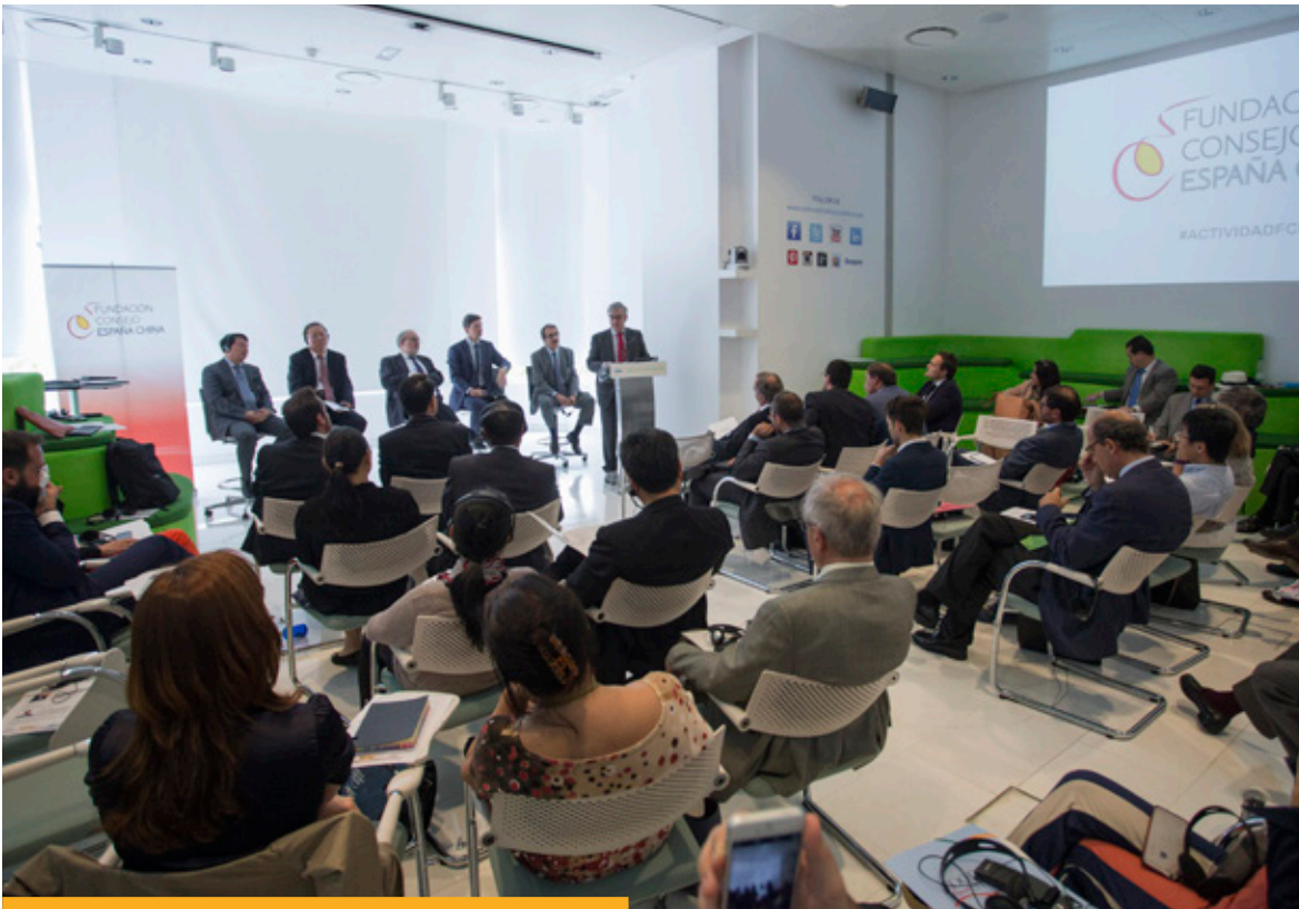
El secretario de Estado de Asuntos Exteriores, Ignacio Ybáñez, interviene en el I Seminario de centros de pensamiento España-China, organizado por la Fundación Consejo España China, en junio de 2016.