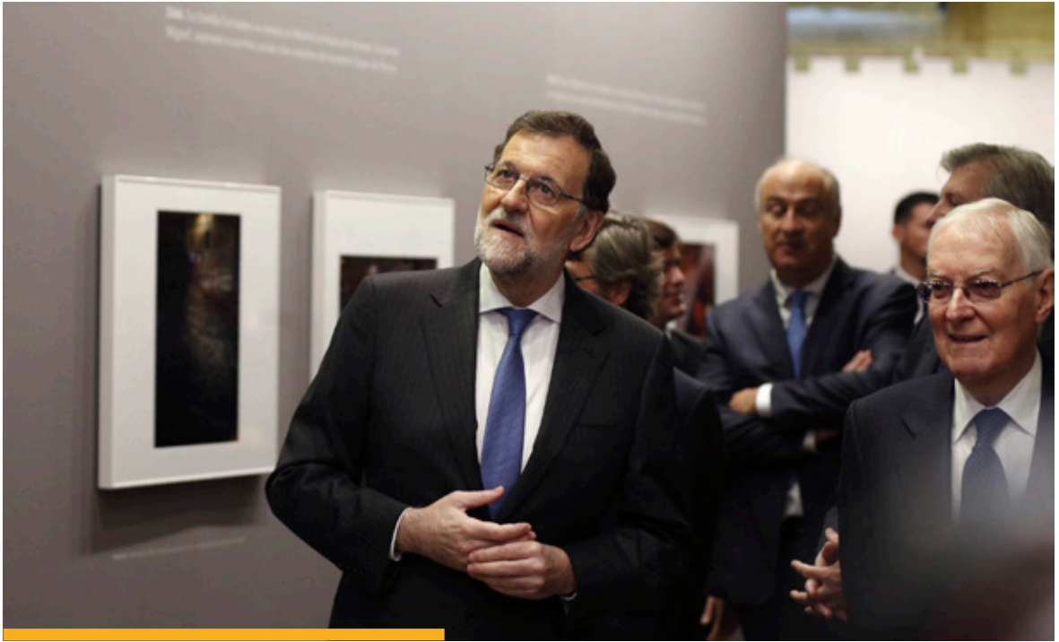
El presidente del Gobierno, junto al director del Instituto Cervantes, durante la inauguración de una exposición conmemorativa del IV Centenario del fallecimiento de Miguel de Cervantes, en la sede del Instituto Cervantes, en abril de 2016.