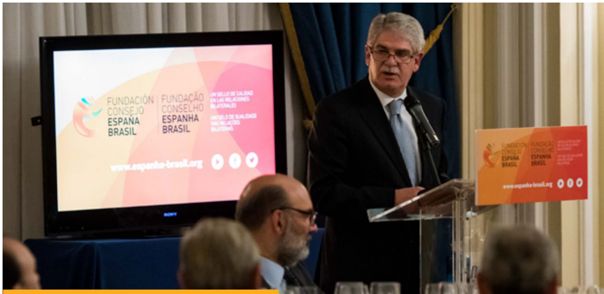
El ministro de Asuntos Exteriores y de Cooperación, Alfonso Dastis, en la cena de bienvenida a su homólogo brasileño, José Serra, organizada por la Fundación Consejo España Brasil, el 22 de noviembre de 2016.

de diplomacia pública que incluye entre otros instrumentos la acción cultural exterior, el Instituto Cervantes, la Marca España, las 8 Fundaciones-Consejo (magnífico instrumento de colaboración público-privada) o la Red de Casas. Todas ellas buscan abrir el diálogo con sociedades civiles extranjeras, fomentar el conocimiento y el respeto mutuo, y reforzar nuestros lazos con otros países y culturas.