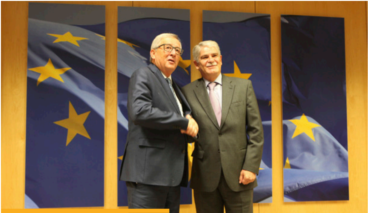
El ministro de Asuntos Exteriores y de Cooperación, durante un encuentro de trabajo con el presidente de la Comisión Europea, Jean-Claude Juncker, celebrado en noviembre de 2016.

Asimismo, España ha participado activamente en los debates sobre la revisión a medio plazo del Marco Financiero Plurianual (Reglamento Omnibus), que incluye importantes medidas de simplificación de la PAC en lo que se refiere a la definición de agricultor activo y a la aplicación de sus disposiciones a los jóvenes agricultores. También ha participado en los debates sobre el reforzamiento de la posición de los agricultores en la cadena alimentaria, aprobando el Consejo sus conclusiones en el mes de diciembre.