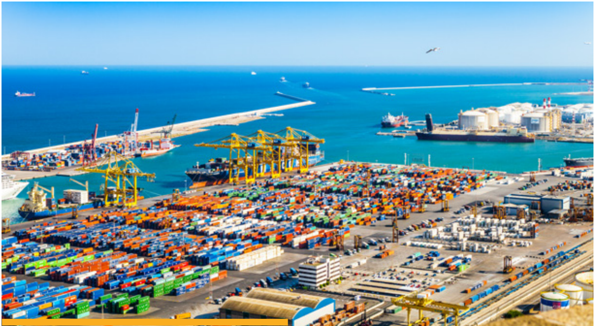
Imagen del puerto de Barcelona, uno de los más activo en tráfico de mercancías del Mediterráneo.

Se pueden destacar las siguientes actuaciones realizadas en ejecución de la Estrategia de acción exterior: