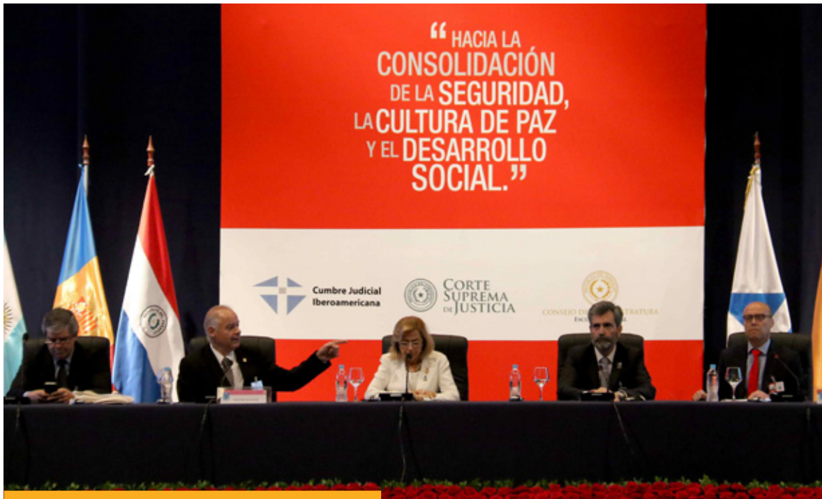
El presidente del Consejo General del Poder Judicial de España, Carlos Lesmes, durante su participación en la XVIII Cumbre Judicial Iberoamericana, celebrada en Asunción (Paraguay) en abril de 2016.

instructores (jueces o fiscales) para ordenar y organizar el trabajo que derive de una investigación transnacional.