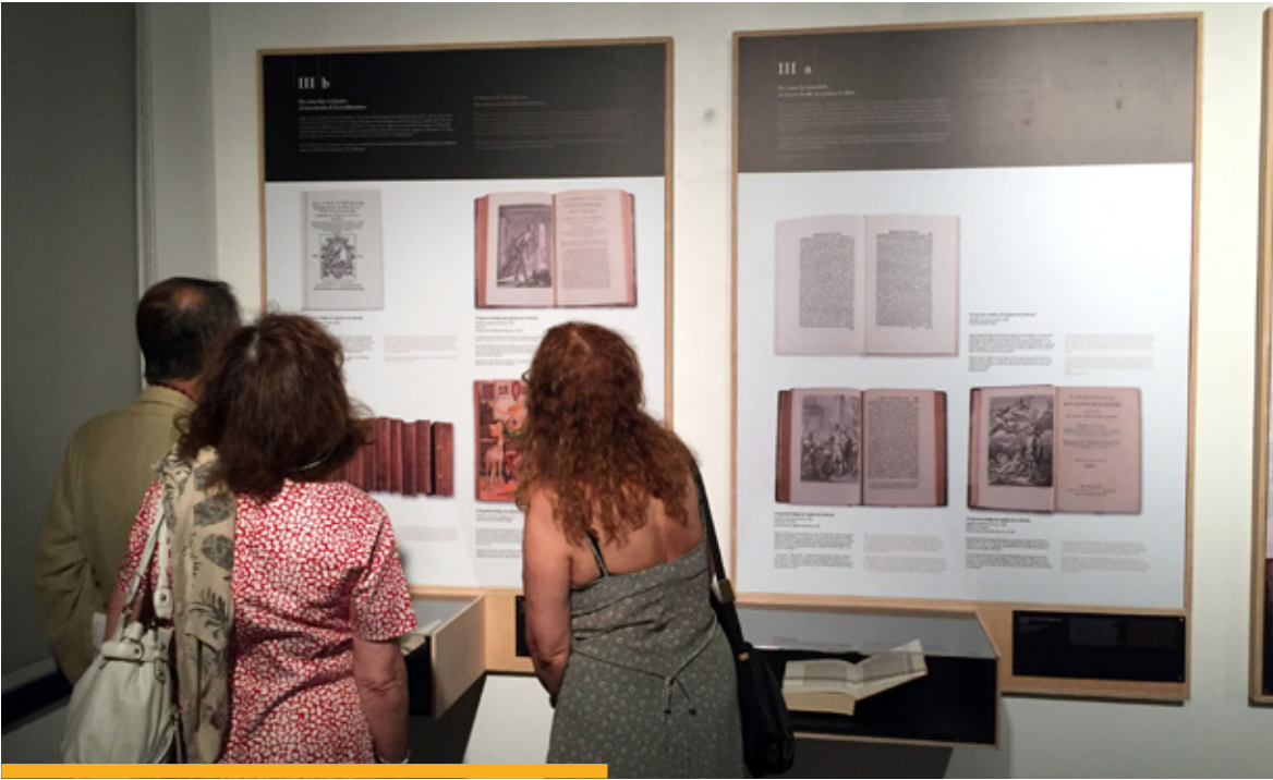
Exposición "Quijotes por el mundo" organizada por el Instituto Cervantes de Nueva York en 2016.

tes en la Academia de España en Roma (gracias a las becas que cada año concede la Dirección de Relaciones Culturales y Científicas).