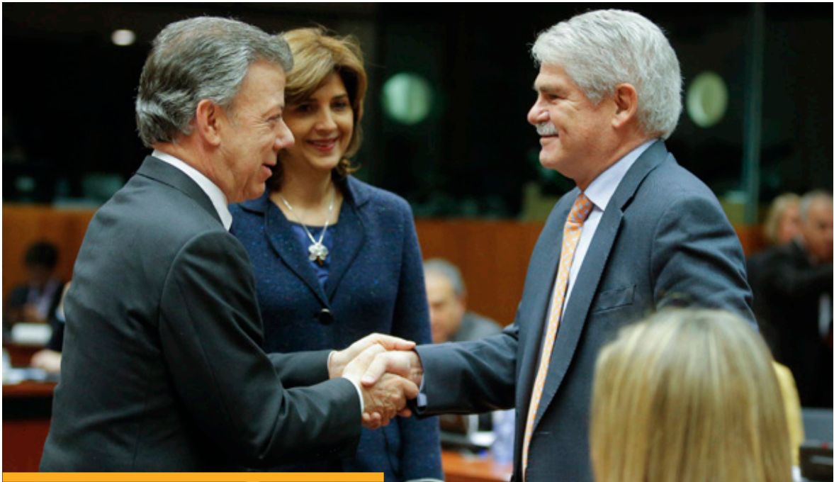
El ministro de Asuntos Exteriores y de Cooperación, saluda al presidente de Colombia, Juan Manuel Santos, durante un encuentro en Bruselas, el 12 de diciembre de 2016.

a España de los presidentes de Colombia, Perú y Uruguay, entre otras autoridades.