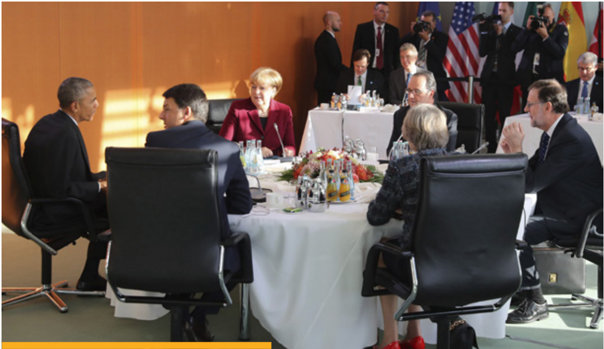
El presidente del Gobierno, Mariano Rajoy, junto a la canciller alemana, Angela Merkel, el presidente francés, François Hollande, la primera ministra británica, Theresa May y el primer ministro italiano, Matteo Renzi, durante un almuerzo de despedida con el presidente estadounidense, Barack Obama, celebrado en Berlín (Alemania) en noviembre de 2016.

Igualmente se comunicó a los portavoces de la Comisión de Asuntos Exteriores del Congreso de los Diputados el 15 de septiembre.