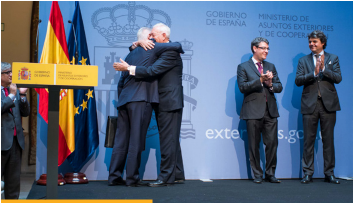
Traspaso de la cartera del Ministerio de Asuntos Exteriores y de Cooperación entre José Manuel García-Margallo y Alfonso Dastis, celebrada el 4 de noviembre de 2016 en el Palacio de Santa Cruz.

De acuerdo con la prioridad, establecida en la Estrategia de acción exterior, de situar al ciudadano en el centro de la política exterior, España ha continuado desarrollando una importante labor de asistencia y protección consular , gracias a su red de oficinas consulares en todo el mundo. La prioridad puesta en los españoles implica también una política exterior dirigida a contribuir al crecimiento económico y a la creación de empleo en nuestro país. Para ello, la acción exterior sigue impulsando un cambio de modelo económico que pasa por una mayor internacionalización de la economía española .