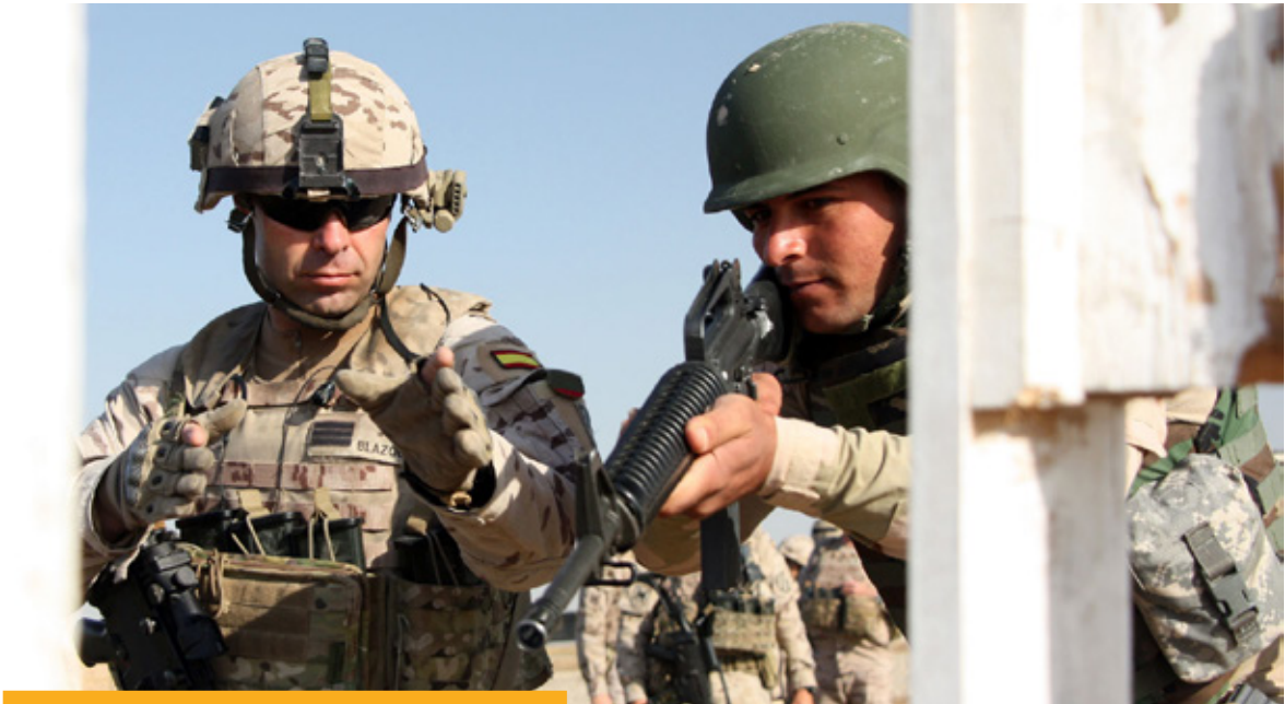
Militares españoles instruyendo al ejército iraquí.

de armas o mecanismos explosivos. Frente a ello, uno de los objetivos prioritarios es privar a DAESH de todo control sobre un territorio. Como miembro de la Coalición y en su dimensión militar, España realiza diversas aportaciones, entre otras la de proporcionar formación a las fuerzas armadas iraquíes en atención a la solicitud del Gobierno de Irak. Para ello, nuestro país envió 300 militares a Irak en 2015, y en diciembre de 2016 el Gobierno solicitó autorización de las Cortes para aumentar este número hasta un máximo de 150 más (125 militares y 25 guardias civiles), llegando en 2017 a un máximo de 450 efectivos (actualmente hay desplegados 434 efectivos). Dado que la amenaza de DAESH afecta a múltiples sectores, y dado que persistirá todavía cuando haya perdido el territorio que ahora controla, la Coalición, además de su dimensión militar, actúa en otros sectores: CTE, Comunicación estratégica, lucha contra la financiación de DAESH, estabilización de los territorios recuperados del control de DAESH. España participa en todos ellos mediante una intensa coordinación interministerial.