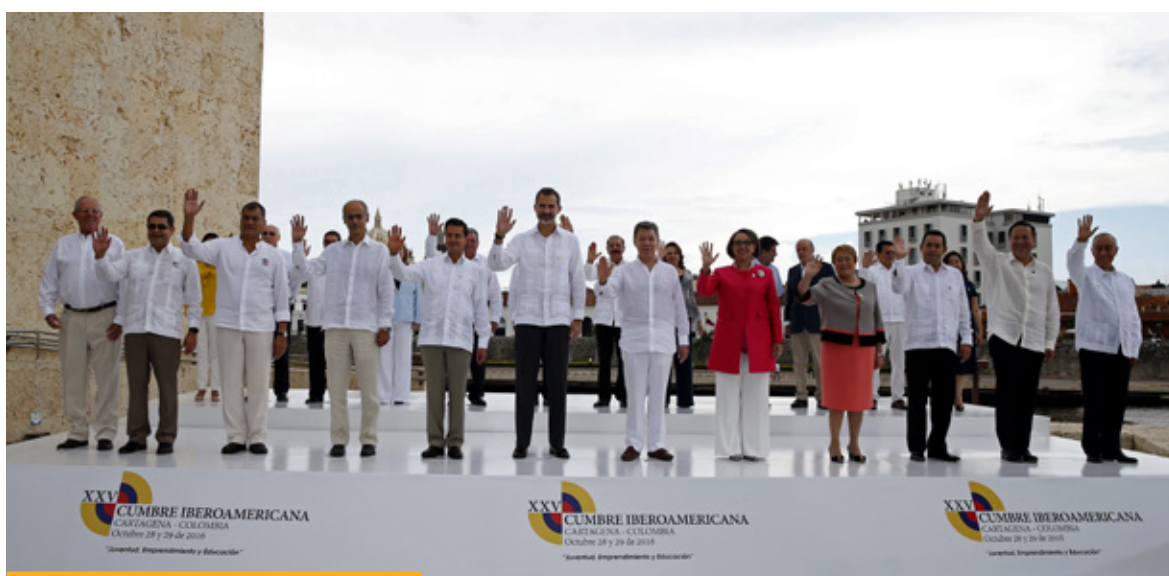
Fotografía de familia de la XXV Cumbre Iberoamericana, celebrada en Cartagena de Indias en noviembre de 2016.