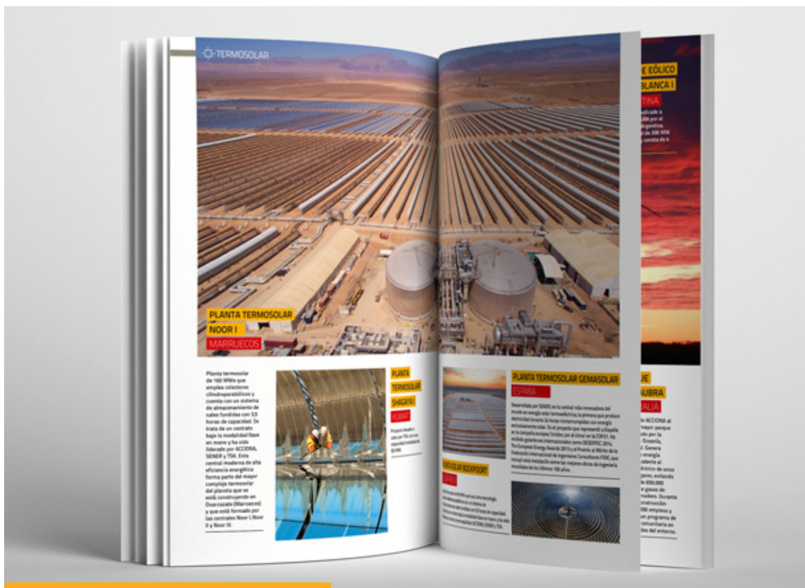
Publicación "Las Empresas españolas, líderes mundiales en energías renovables, editada por el Ministerio de Asuntos Exteriores y de Cooperación.

Los ámbitos en los que las empresas españolas han tenido más éxito son Transporte, Infraestructuras y Energía, pero también en Finanzas, Telecomunicaciones, Biotecnología, e Ingeniería.