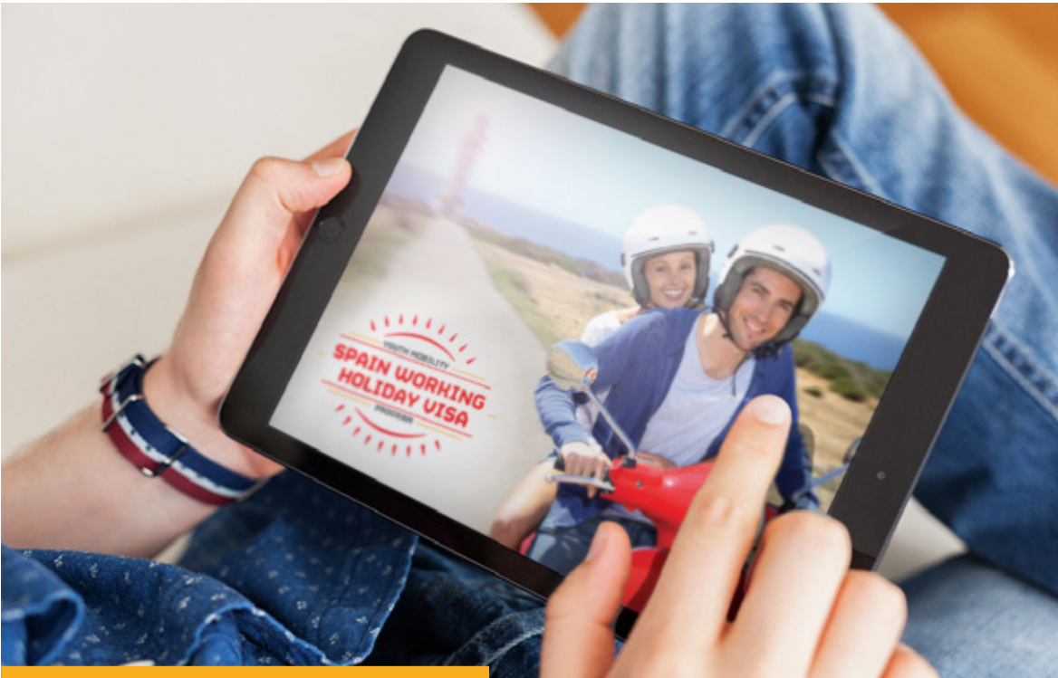
Imagen de la campaña 'Spain Working Holiday Visa' realizada por la Oficina de Información Diplomática.

El Ministerio de Asuntos Exteriores y de Cooperación ha elaborado a lo largo del año 2016 un total de 36 infografías y 20 vídeos, con el fin de difundir la política exterior de España y los servicios consulares prestados a los ciudadanos, todo ello presentado de una forma amena, esquemática y visual.