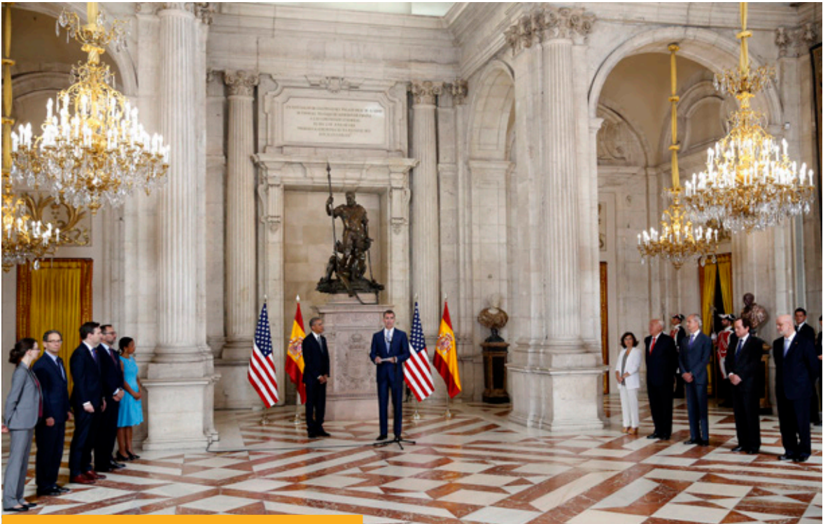
S.M. el Rey Felipe, recibe al presidente de Estados Unidos, Barack Obama, en el Palacio Real, en julio de 2016.

bitos de derechos humanos, gobernanza del agua, tributos, y transporte de mercancías peligrosas.