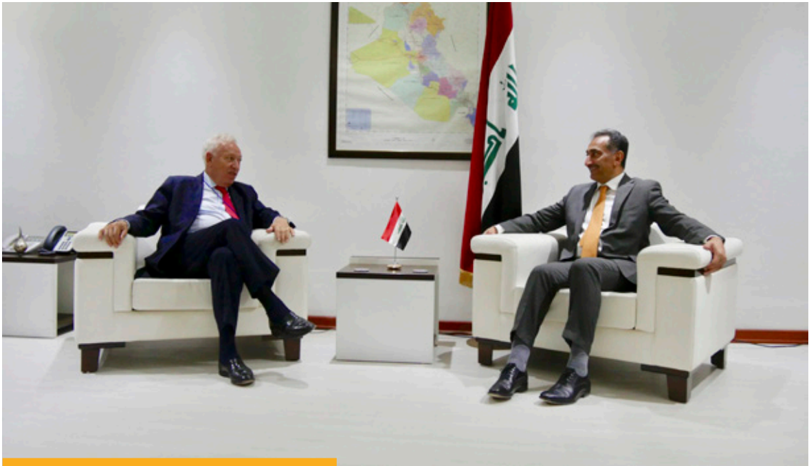
El anterior ministro de Asuntos Exteriores y de Cooperación, José Manuel García-Margallo, durante su encuentro con el viceministro iraquí de Exteriores, Nizas Abdulhadi al Jairalá, durante su visita a Bagdad el 24 de octubre de 2016.

lizar la situación sobre el terreno y adoptar medidas encaminadas a facilitar el acceso de la ayuda humanitaria, sobre todo a zonas sitiadas o de difícil acceso. En el marco del Consejo de Seguridad, como miembros no permanentes, respaldamos activamente al Enviado Especial de Naciones Unidas para Siria, Staffan de Mistura, en sus esfuerzos por facilitar el diálogo político intrasirio en aras de poner fin al conflicto mediante una transición política democrática e inclusiva en los términos contenidos en la resolución 2254, aprobada por el Consejo en diciembre de 2015, con apoyo de España.