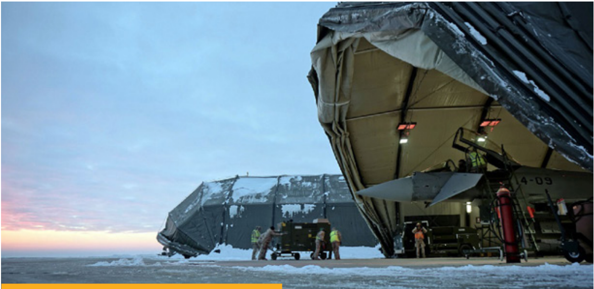
Militares y aviones españoles integrados en la Policía Aérea Báltica en Lituania, en enero de 2016.

nes Navales Permanentes. Otra muestra del compromiso de España con sus aliados es el despliegue en enero de 2015 de una batería de misiles Patriot en Turquía, en Adana, cerca de la frontera con Siria.