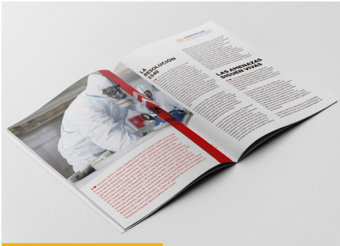
Imagen del folleto editado de la presidencia española del Comité 1540 en Naciones Unidas.

dos de trabajo. En ese debate defendimos dar más juego a los redactores, y apoyamos la distribución conjunta de las presidencias de comités del CSNU por un miembro permanente y uno electo. También continuamos celebrando los desayunos de trabajo con la presidencia rotatoria del Consejo de Paz y Seguridad de la UA.