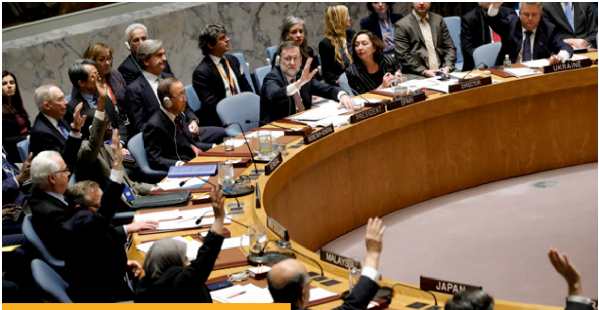
El presidente del Gobierno, Mariano Rajoy, en el marco de la presidencia española, durante una sesión del Consejo de Seguridad de Naciones Unidas celebrada el 20 diciembre de 2016.

siglas en inglés). La FRA proporciona asesoramiento independiente a los responsables de la toma de decisiones nacionales y de la UE en materia de derechos fundamentales. El OBERAXE recoge las propuestas de los distintos departamentos de la administración del Estado en relación con los informes que la FRA lleva a cabo. En junio de 2016 tuvo lugar el “Fundamental Rights Forum” con el objeto de analizar los retos existentes, reflexionar sobre ellos, e identificar modos innovadores de avanzar. En el Foro se han establecido dos subgrupos de trabajo, uno sobre discurso de odio on-line, y otro sobre metodologías para la recolección y registro de datos sobre delitos de odio.