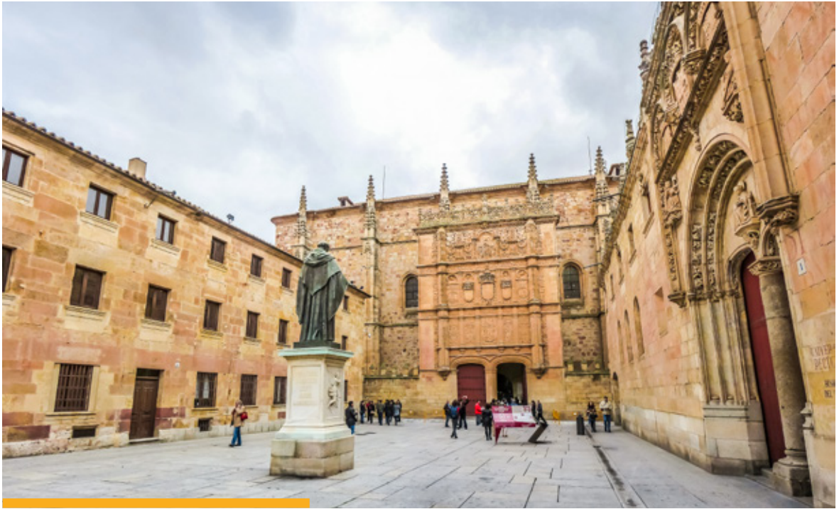
Fachada de la Universidad de Salamanca.

concurrencia competitiva. El objetivo es la máxima difusión de las letras españolas a nivel mundial.