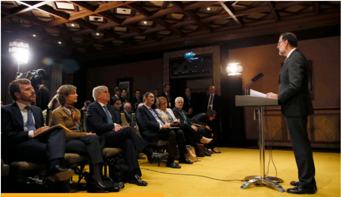
El presidente del Gobierno, Mariano Rajoy, comparece ante los medios de comunicación tras asistir a la Convención Marco de las Naciones Unidas sobre el Cambio Climático celebrada en Marrakech (Marruecos), el 15 de noviembre de 2016.

se suman las acciones en favor de la protección del medio ambiente y humano.