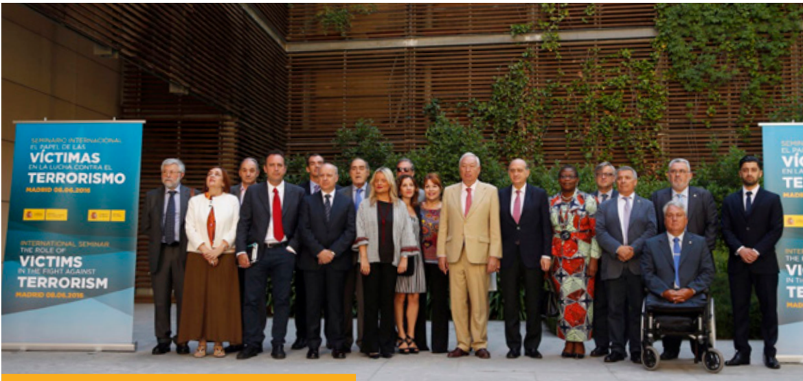
Fotografía de familia del Seminario Internacional sobre "El Papel de las Víctimas en la Lucha contra el terrorismo" celebrado en el Ministerio de Asuntos Exteriores y de Cooperación, en junio de 2016.

que deslegitimen el terrorismo, y que eviten la radicalización de nuevas generaciones. España sostiene como una clara prioridad de su política antiterrorista el reconocimiento de la dignidad y los derechos de las víctimas del terrorismo, que ha inspirado la Ley 29/2011 de Reconocimiento y Protección Integral a las Víctimas del Terrorismo.