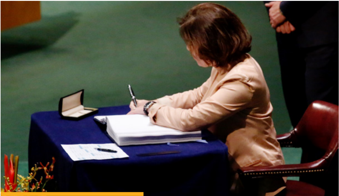
La vicepresidenta del Gobierno, Soraya Sáez de Santamaría, firma en la sede de Naciones Unidas el acuerdo de cambio climático en abril de 2016.

bre el Cambio Climático y la Desertificación como amenaza para la estabilidad en el Sahel, organizada por España en colaboración Egipto. Permitió analizar de una manera holística las posibles repercusiones que el Cambio Climático puede suponer para la seguridad de una región que ya figura en la agenda del Consejo de Seguridad. Este enfoque no tiene precedentes en el Consejo de Seguridad puesto que reunió al Representante Especial del Secretario General para el Sahel, a la Directora Ejecutiva de la Convención de Naciones Unidas para la lucha contra la Desertificación, y al Director Ejecutivo del Comité de Lucha contra el Terrorismo