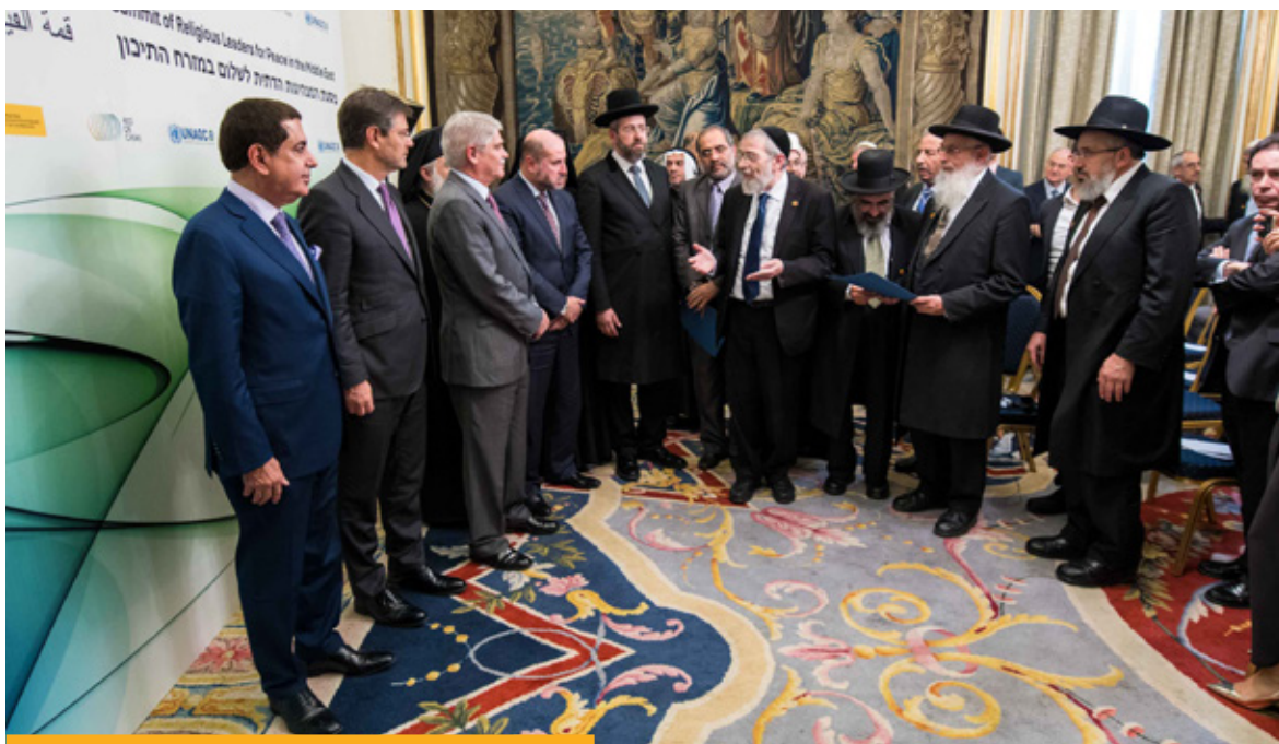
El ministro de Asuntos Exteriores y de Cooperación, junto al ministro de Justicia, en la Cumbre de líderes religiosos por la paz en Oriente Medio, celebrada en Madrid en el mes de noviembre de 2016.

Palestinos ocupados, EUPOL Afganistán, EUCAP NESTOR Cuerno de África, EUCAP SAHEL Níger, EUBAM Libia, EUAM Ucrania y EUCAP SAHEL Mali).