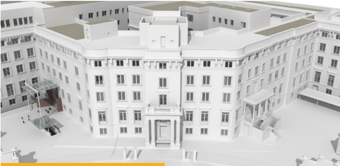
Simulación de la futura sede del Ministerio de Asuntos Exteriores y de Cooperación en la plaza del Marqués de Salamanca.

• Medidas de apoyo al personal destinado en el exterior: la Unidad de Apoyo a las Familias de los funcionarios del Servicio Exterior, creada en 2014, durante el año 2016 llevó a cabo numerosas gestiones y estudios en el marco del desarrollo de las previsiones del Plan Integral de Apoyo a la Familia (2015-2017) (medidas 197 a 201) con el fin de mejorar la indemnización por educación para hijos de funcionarios expatriados, la incorporación de hijos de funcionarios con régimen de movilidad forzosa al sistema de educación pública de la Comunidad de Madrid y las oportunidades laborales de los cónyuges de funcionarios del Servicio Exterior.