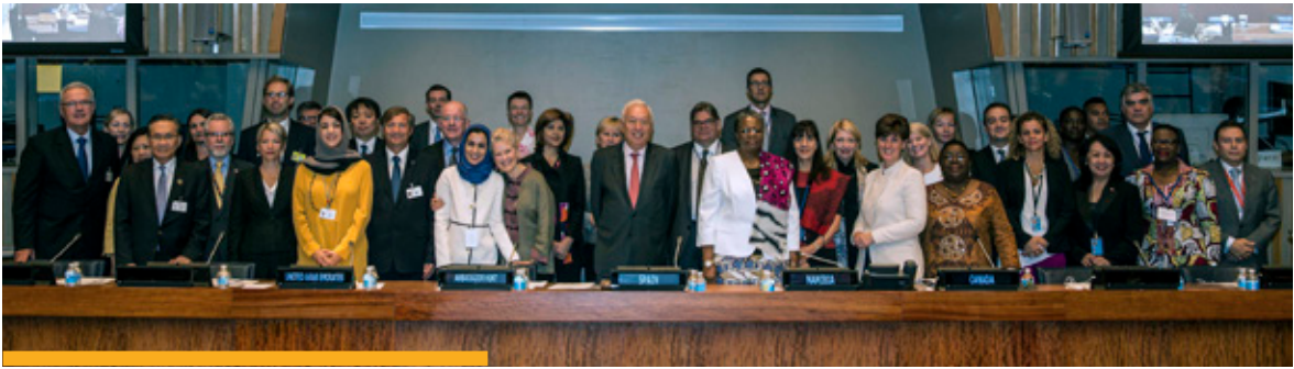
Fotografía de familia de la reunión para el lanzamiento de la Red de Puntos Focales de MPS, convocado por España en septiembre de 2016.

España participó, finalmente, en la Conferencia de Mujeres para el Mediterráneo , organizada en Barcelona por la Unión por el Mediterráneo (10-11 octubre).