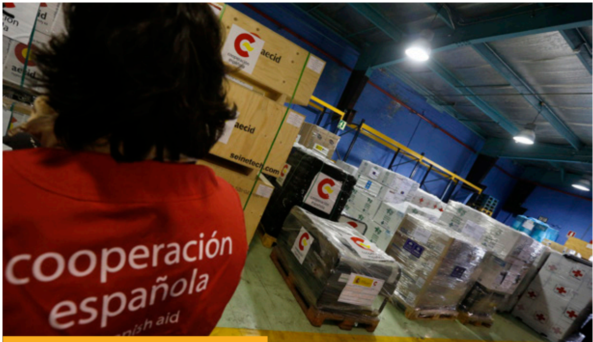
Imagen de uno de los envíos de ayuda humanitaria realizados por la Agencia Española de Cooperación Internacional desde la Base Aérea de Torrejón de Ardoz, con motivo del terremoto que sacudió Ecuador en abril de 2016.