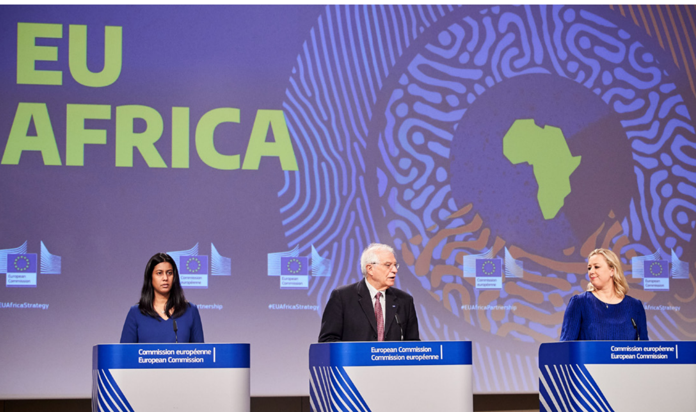
El Alto representante de la Unión Europea para Asuntos Exteriores y Política de Seguridad, Josep Borrell, junto a la Comisaria para las Asociaciones Internacionales, Jutta Urpilainen, durante la rueda de prensa de presentación de la nueva estrategia UE-África, el 9 de marzo de 2020.

de la Cooperación Española en el continente; 4) la solidaridad de la sociedad civil española; 5) una cultura y una lengua universales; 6) el compromiso con la paz y la seguridad de nuestras Fuerzas Armadas y Fuerzas y Cuerpos de Seguridad; y 7) su posición geográfica de país bicontinental, con más de dos millones de ciudadanos residentes en Canarias, Ceuta y Melilla.