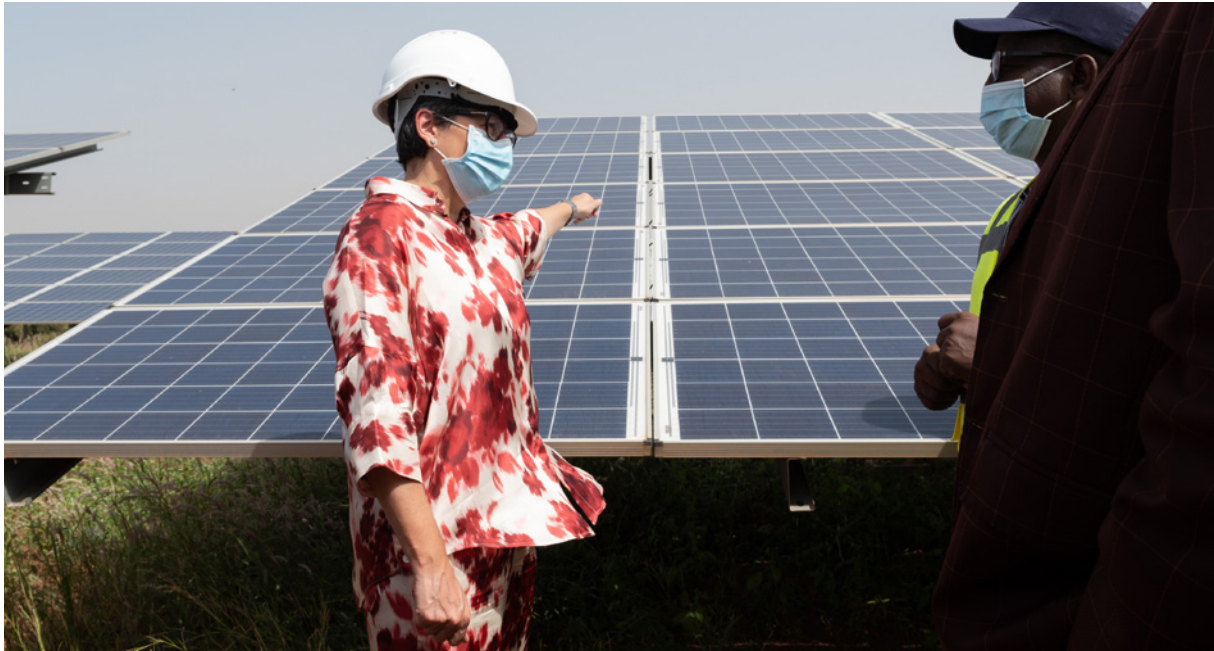
La Ministra de Asuntos Exteriores, Unión Europea y Cooperación, Arancha González, durante su visita a la planta solar de Zagtoui (Burkina Faso), que tiene una extensión de 60 hectáreas.

climático. Son de especial interés: infraestructuras de agua y de saneamiento; almacenamiento, distribución y tratamiento de aguas; infraestructuras de ciclo completo.