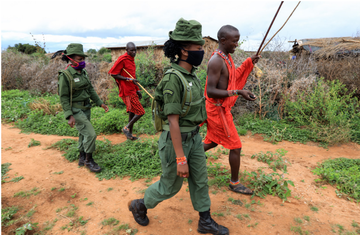
Empleadas del servicio de guardabosques de Kenia hablan junto a miembros de la comunidad masi, en Amboseli (Kenia), durante una patrulla en mayo de 2020.