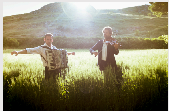
Fetén Fetén

Más conciertos de la gira en Austria de Fetén Fetén: