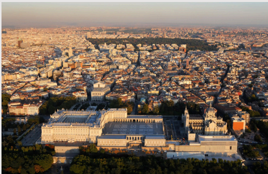
Panorámica del Palacio Real y de la Galería de las Colecciones Reales de Madrid