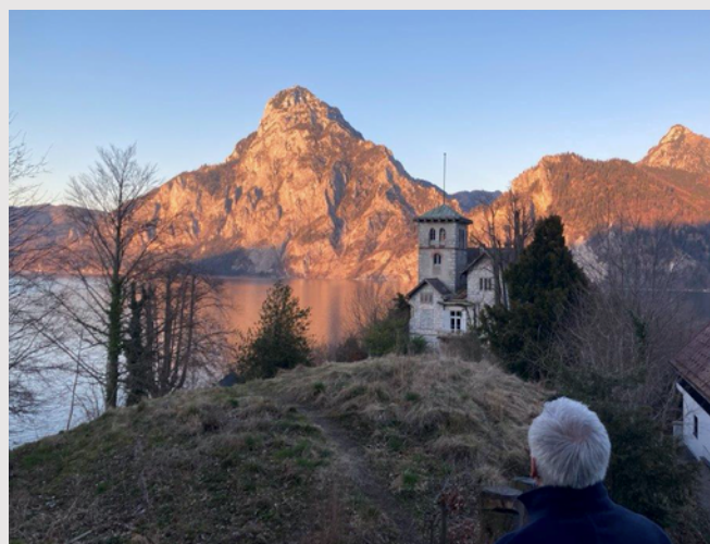
Villa Pantschoulidzeff in Traunkirchen