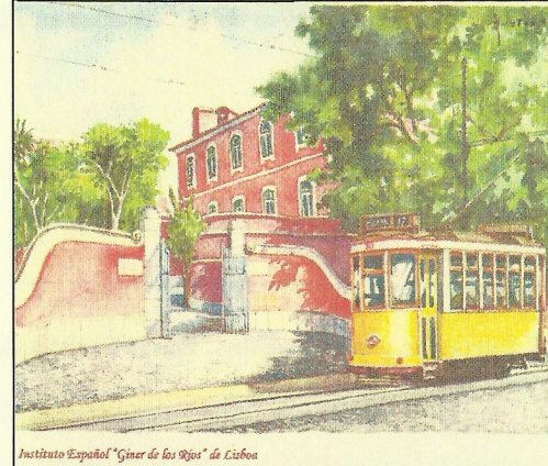
Instituto Español “Giner de los Ríos” de Lisboa