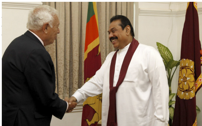
El anterior ministro de Asuntos Exteriores y de Cooperación, José Manuel García-Margallo, saluda al entonces presidente de la República de Sri Lanka, Mahinda Rajapaksa, durante su visita a Colombo, en septiembre de 2014.