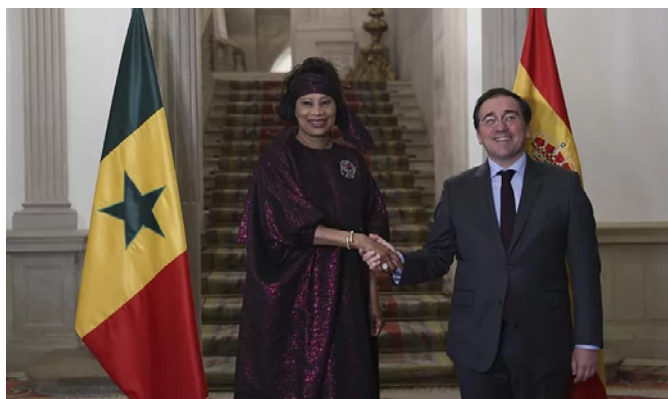
El ministro de Asuntos Exteriores, Unión Europea y Cooperación José Manuel Albares, con la ministra de Asuntos Exteriores y de Senegaleses en el Exterior de la República del Senegal, Aïssata Tall Sall, en el Palacio de Viana.- Madrid 11 de enero de 2023.- foto: EFE

El presidente de la República, Macky Sall, visitó Madrid el 15 de diciembre de 2014 y mantuvo reuniones de trabajo con SM el Rey y con el Presidente del Gobierno.