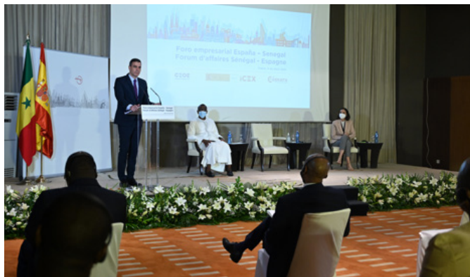
El presidente del Gobierno, Pedro Sánchez, durante su intervención en el acto de clausura del Foro empresarial España-Senegal.-Dakar (Senegal).- 9 de abril de 2021.-Foto: Pool Moncloa/Borja Puig de la Bellacasa