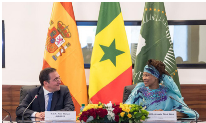
Encuentro entre el Ministro de Asuntos Exteriores, UE y Cooperación, José Manuel Albares, y su homóloga senegalesa, Aïssata Tall Sall –Senegal 21/07/2022