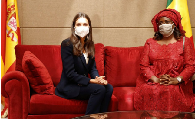
Con motivo del viaje a Senegal, encuentro entre SM la Reina Letizia y la primera dama del país, Marie Faye Sall.- 15 diciembre 2021.

2021 se procedió a la apertura del primer Instituto Cervantes en Dakar, que será el primero situado en África Sub-sahariana.