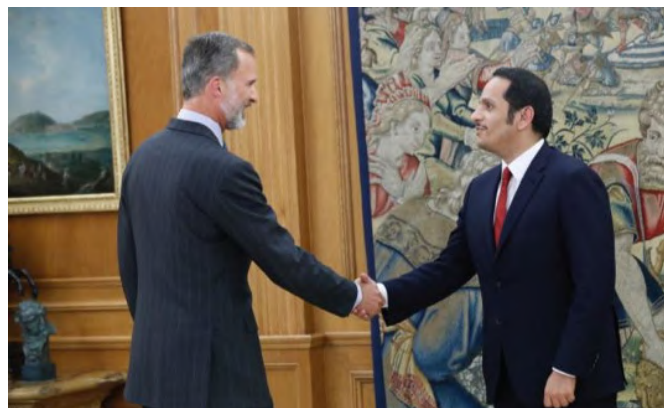
SM el Rey recibe el saludo del vice primer ministro y ministro de Asuntos Exteriores del Estado de Qatar, su excelencia el Jeque Mohammed Bin Abdulrahman Al-Thani.- Palacio de La Zarzuela. Madrid, 13.09.2018.

En el gobierno local, el Consejo Central Municipal, de 29 miembros, es elegido democráticamente desde 1999 (las últimas elecciones tuvieron lugar en 2019).