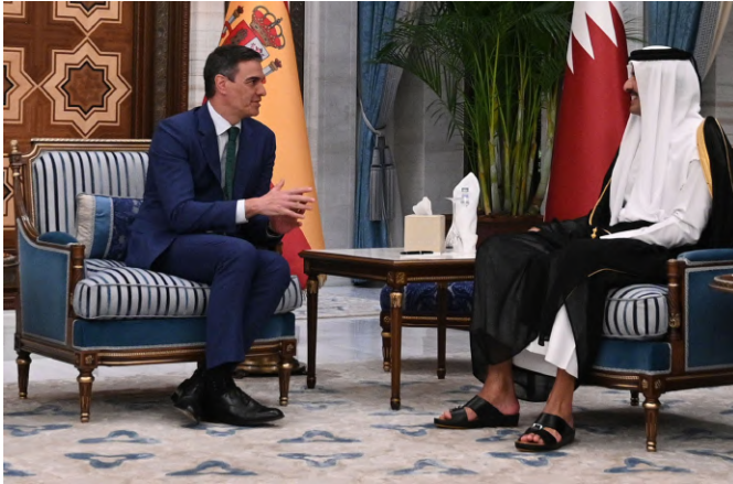
El presidente del Gobierno, Pedro Sánchez, en su encuentro con el emir de Catar, Tamim Bin Hamad Al Thani. Doha (Catar) 3.4.2024

información. La presencia de empresas españolas establecidas en Qatar ha ido creciendo en los últimos años destacando Iberdrola, FCC, Sacyr, Acciona Agua y Medio Ambiente, Aguas de Valencia, entre otras.