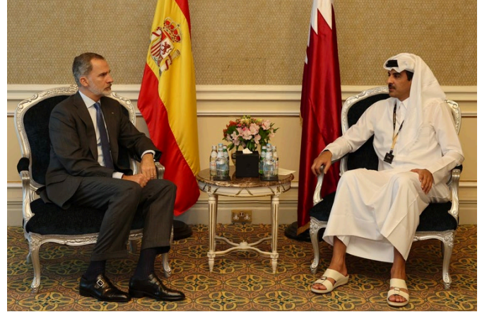
Reunión entre Felipe VI y el emir de Qatar.-Doha 23/nov/2022.-foto: CASA DE S.M. EL REY

El PIB de Qatar alcanzó en 2022 los 225.700 MUSD. En paridad de poder adquisitivo Qatar posee una de las rentas per cápita más alta del mundo (106.004 USD) gracias a sus recursos naturales en gas y petróleo. El estado de Qatar es el tercer mayor productor de gas natural del mundo y el mayor de Gas Natural Licuado (GNL), exportando el 75% de lo producido. Sus principales mercados son: Corea del Sur (21,5% del total de exportaciones), India (14,5%), China (14,4%) y Japón (13,9%). Actualmente, apuesta por aumentar su producción en más de un 60% hasta los 126M de toneladas año previstas en 2027.