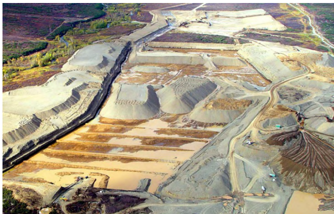
La compañía española MAXAM proveerá en exclusiva los productos y servicios para voladuras de una de las minas de oro y cobre más grande del mundo.