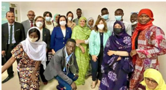
La secretaria de Estado de Cooperación Internacional, Pilar Cancela, visita Mauritania.- 20/03/2022.-foto: AECID