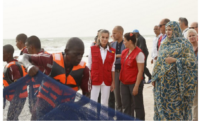
Su Majestad la Reina Letizia observa el trabajo de los pescadores a su llegada tras la jornada de pesca.- Nuakchot (República Islámica de Mauritania), 02.06.2022.

En el plano regional cabe destacar el Acuerdo de libre comercio con la CEDEAO (organización de la que se retiró en el año 1999), y su contribución a la creación del G-5 Sahel, cuya Secretaría Permanente se encuentra en Nuakchot. Mauritania ejerce su presidencia rotatoria anual desde el 25 de febrero de 2020. Junto a Mali, Chad, Níger y Burkina Faso, el G-5 Sahel proporciona un marco de coordinación para dar respuestas de dimensión regional a temas comunes de la región en el marco del binomio seguridad