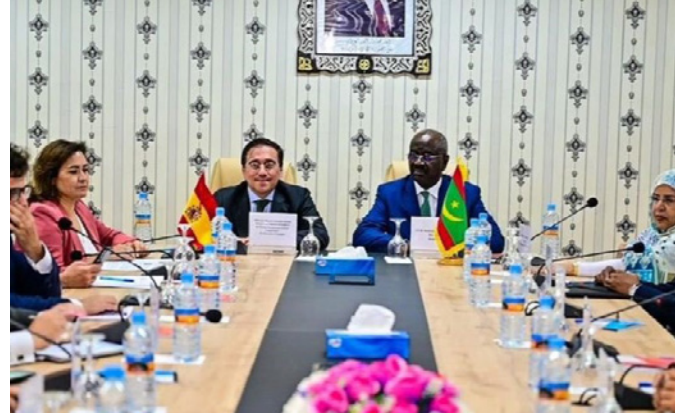
El ministro español de AA.EE, Albares junto a su homólogo mauritano doctor Mohamed Salem Ould Merzoug.- Nouakchott 20/junio/2022.- foto: MAEC