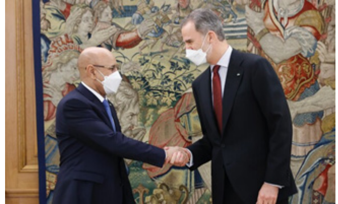
Su Majestad el Rey junto al presidente de la República Islámica de Mauritania, Mohamed Ould Cheikh El Ghazouan.-Madrid 16/03/2022.

Durante la visita del entonces MAEC Teguedi a Madrid en mayo de 2014 se firmó la VII Comisión Mixta y el “Marco de Asociación País” (MAP) 2014-2017. En el Vº Plan Director de la Cooperación Española (2018-2021), se clasifica a Mauritania como país de Asociación Menos Avanzado. En el momento actual está vigente el MAP 2014-2017, que fue prorrogado en octubre de 2017. Firmado en mayo de 2014, asigna 30M € a Mauritania, interviniendo en tres sectores prioritarios: