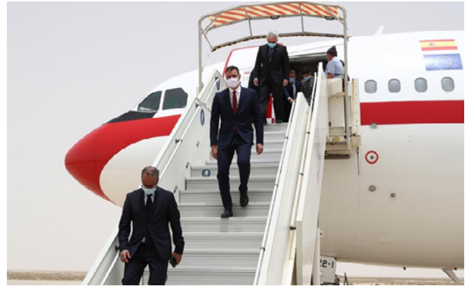
El presidente del Gobierno, Pedro Sánchez, a su llegada a la capital de Mauritania, Nuakchot (Mauritania) - 30/06/20.

La cooperación bilateral en materia de lucha contra la inmigración ilegal sigue siendo excelente, hecho que quedó reflejado en la reducción progresiva de llegadas de inmigrantes a las costas canarias, pasando de 31.678 en 2006 a 450 en 2017. No obstante, a partir del año 2018, se invirtió la tendencia y comenzaron a incrementarse las llegadas de inmigrantes a Canarias, con 1.291 en 2018 (+188% respecto al año 2017), 2.702 en 2019 (+109% respecto al año 2018) y 23.420 en 2020, la mayor parte durante el último