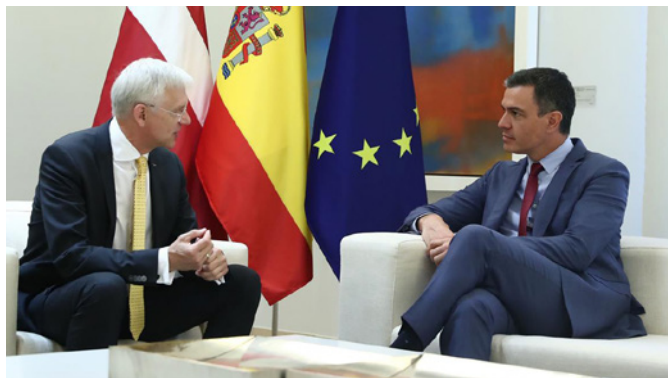
El presidente del Gobierno, Pedro Sánchez, conversa con el primer ministro de la República de Letonia, Arturs Krišjānis Kariņš.-Madrid 13/06/2022.- Foto: Pool Moncloa/Fernando Calvo.

También en España ha crecido el número de residentes originarios de Letonia. Según datos de 2020 del Departamento de Ciudadanía y Migración de Letonia, actualmente residen en España 2.494 ciudadanos y 260 no ciudadanos letones.