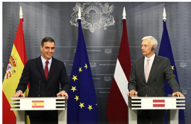
Intervención del presidente del Gobierno, Pedro Sánchez, en comparecencia conjunta con el primer ministro de Letonia, Arturs Krišjānis Karinš.-Riga (Letonia) - miércoles 7 de julio de 2021.

Por último, ha aumentado la atención a la llamada «diáspora». Hay considerables comunidades de letones en Canadá, EEUU, Irlanda y Reino Unido.