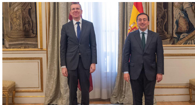
José Manuel Albares recibe a su homólogo Edgars Rinkēvičs en el centenario de las relaciones diplomáticas entre Letonia y España.-Madrid (Palacio de Viana) 26/04/2022.- foto Elena Martín (Nolsom) / MAEUC