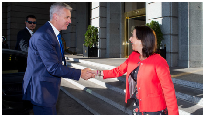
La ministra de Defensa, Margarita Robles recibe al viceprimer ministro y ministro de Defensa de Letonia Artis Pabriks.- Madrid 04/09/2019.

En general existe un apoyo social mayoritario a la pertenencia a la UE en la