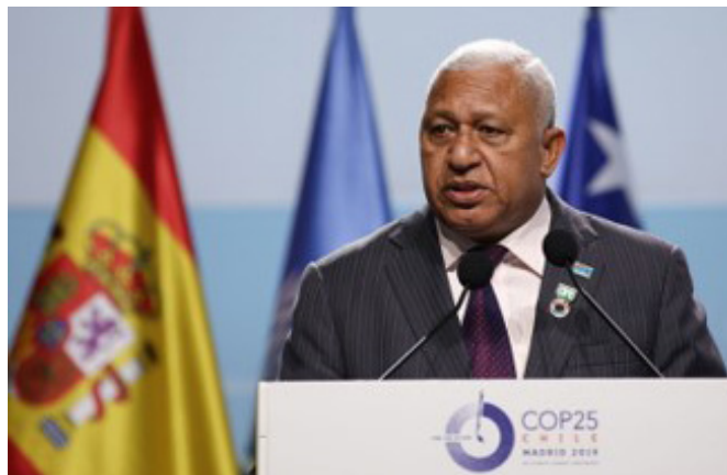
El primer ministro Josaia Voreqe Bainimarama, durante su intervención en la cumbre COP25-Madrid, diciembre de 2019.

Fiji forma parte de las Naciones Unidas desde 1970. Actualmente, tiene 326 unidades desplegadas en siete misiones de mantenimiento de la paz bajo mandato de Naciones Unidas, en particular en Irak y Sudán del Sur.