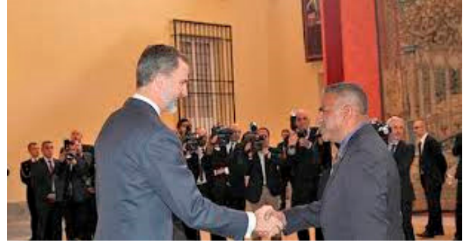
Su majestad el rey Felipe VI saluda al entonces ministro de Industria, Comercio y Turismo Tierras y Recursos Minerales, Faiyaz Koya, con motivo del lanzamiento del Año Internacional de Turismo Sostenible para el Desarrollo 2017 de la Organización Mundial del Turismo de las Naciones Unidas.- Enero 2017.- Foto: Noticias DEPTFO

Nota del Gobierno de Fiji considerando en vigor el Tratado hispano-británico de extradición de 4 de junio de 1878 y enmendado por la Declaración de 19 de febrero de 1889.