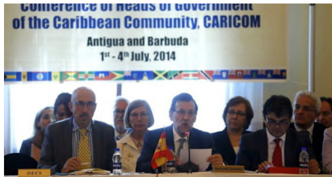
El anterior presidente de Gobierno, D. Mariano Rajoy, en la XXXV Cumbre de jefes de Estado y de Gobierno de la CARICOM, celebrada en Antigua y Barbuda, julio 2014

En el campo de la Salud, Antigua fue parte beneficiaria de un Proyecto de Prevención y Control del Cáncer de Cuello Uterino, en el marco del cual el Mount St John's Medical Centre recibió la donación de un colposcopio en enero de 2010.