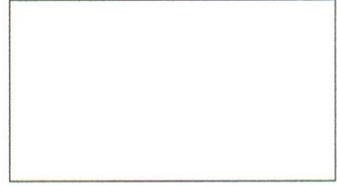
Doctor's License Number (Número de Registro)

In _____ Day _____ Month _____ Year _____ (En) (Día) (Mes) (Año)