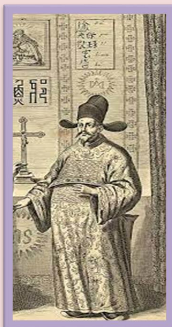
Diego de Pantoja

https://dbe.rah.es/biografias/20766/diego-de-pantoja