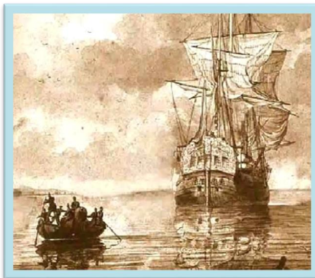
Navío Nuestra Señora del Buen Consejo

https://armada.defensa.gob.es/archivo/mardigitalrevistas/cuadernosihcn/69cuaderno/cap05.pdf