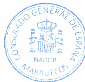
El Bekkaye Bahi