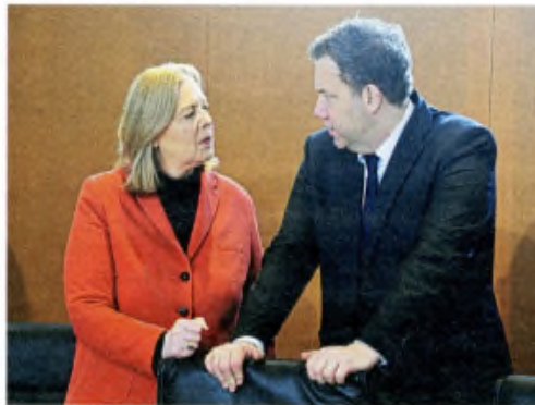
Jörn Maczuga / AFP