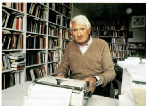
Richard W. Becker / dpa

Das Image Dubais basiert auf Sicherheit. Der Irankrieg ist ein Schock. Seite 50