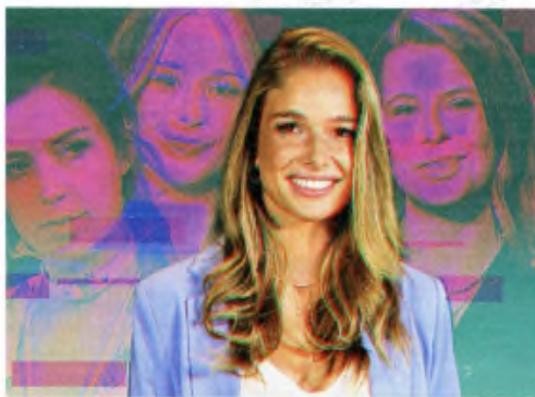
DU JOURN SPIEGEL, MAGAS