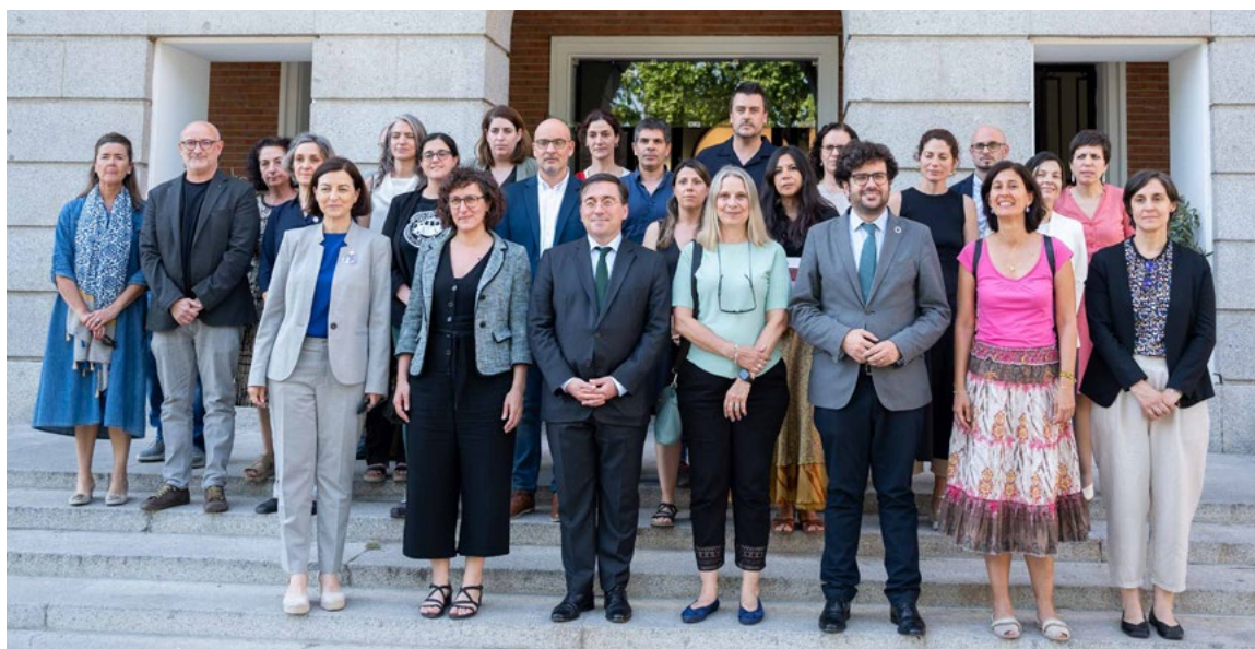
Reunión con asociaciones Palestinas. Sede de la AECID, 29 de mayo.

España mantuvo consultas políticas con Egipto en 2024 a nivel ministerial. El ministro de Asuntos Exteriores, Unión Europea y Cooperación viajó en marzo a El Cairo se reunió también con el secretario general de la Liga Árabe, dirigiéndose al Consejo de dicha organización. España recibió la visita del ministro de Asuntos Exteriores egipcio para abordar la situación en Gaza y en Oriente Medio, así como la del ministro de