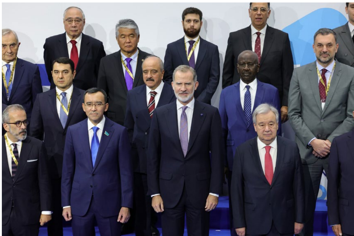
S. M. el Rey en la apertura del 10º Foro Global de la Alianza de Civilizaciones. Portugal, 26 de noviembre.

hombres y mujeres y la lucha contra todo tipo de discriminación, además de la defensa del derecho internacional humanitario. Este compromiso se refleja en el papel que desempeña España en los instrumentos internacionales de promoción de la democracia y fortalecimiento del Estado de derecho, desde la mediación hasta las misiones de observación y asistencia electoral, a través de instituciones como el Consejo de Europa o la OSCE. Asimismo, la contribución de España al mantenimiento de la paz y seguridad internacionales se materializa a través de su participación en la OTAN, la política común de seguridad y defensa de la UE, y las misiones de la ONU, a las que se suman los foros de cooperación en materia de lucha contra el crimen organizado y el terrorismo, la no proliferación, la ciberseguridad y la defensa contra las amenazas híbridas.