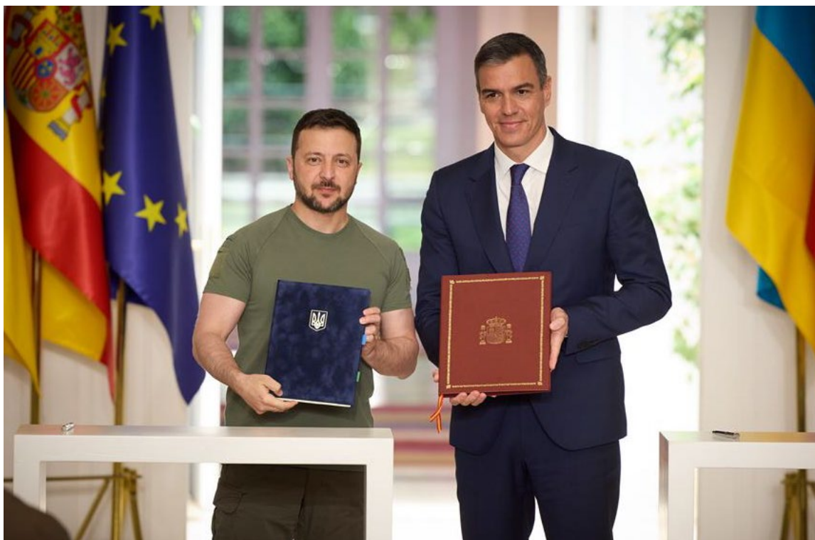
El presidente de Gobierno y el presidente Zelensky en la firma del compromiso con la seguridad y defensa de Ucrania. Palacio de la Moncloa, 28 de mayo.

militares, incluida la defensa antiaérea. Además, se comprometieron 15 millones de euros para la recuperación de Moldavia y Ucrania a través del Banco Mundial; 1,5 millones de euros al Programa de las Naciones Unidas para el Desarrollo para desminado humanitario en Ucrania; y 1,5 millones de euros en material y medios de transporte para fortalecer las capacidades de Ucrania en la lucha contra el crimen y el tráfico de armas y personas. El acuerdo incluyó también ámbitos de cooperación en materia de inteligencia, formación, reconstrucción y asistencia humanitaria.