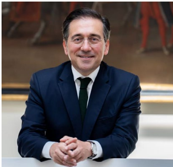
José Manuel Albares Bueno Ministro de Asuntos Exteriores, Unión Europea y Cooperación

2024 ha sido un año de cambios; un año en el que los fundamentos de la paz y la estabilidad global se han visto cuestionados, pero en el que también hemos visto a la inmensa mayoría de los países de la comunidad internacional unirse en la defensa del multilateralismo, el orden internacional y la paz. Ante este escenario, todos vamos a tener que tomar decisiones sobre el camino que queremos recorrer y los valores que nos orientarán, y la opción de España es clara: estamos convencidos de que la mejor defensa de los intereses de España pasa por una política exterior coherente y con identidad propia que refuerza nuestras capacidades y defiende la cooperación, el diálogo y el respeto a la legalidad internacional. Este Informe de Acción Exterior refleja las principales acciones desplegadas a lo largo de 2024 en el marco de esos valores en los que se sustenta la Estrategia de Acción Exterior 2021-2024. Principios que subrayan que la respuesta a los desafíos contemporáneos y la defensa eficaz de nuestros intereses pasan necesariamente por una Europa fortalecida —pilar