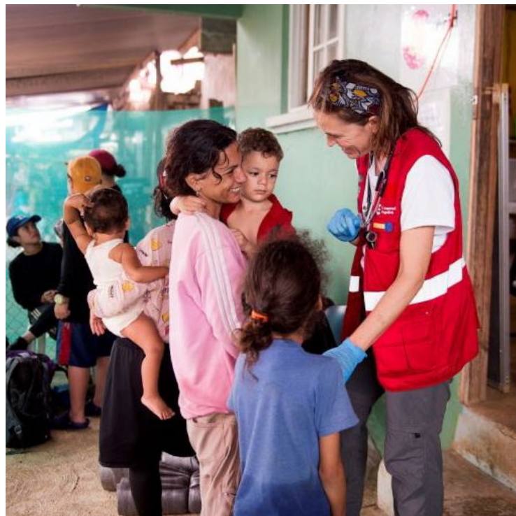
Pacientes esperando a ser atendidos por los voluntarios del Hospital START en la localidad de Bajo Chiquito (Panamá).

En relación con la promoción de un marco de colaboración fiscal internacional más justo y fortalecido, España ha mantenido durante 2024 su activa participación en el comité intergubernamental ad hoc de las Naciones Unidas para la elaboración de un Convenio Marco de cooperación fiscal internacional , de conformidad con la resolución 78/230 relativa a la promoción en las Naciones Unidas de la cooperación internacional inclusiva y eficaz en cuestiones de tributación. Igualmente, en el marco de la OCDE, España ha seguido impulsando los trabajos contra la erosión de las bases imponibles y el traslado ar-