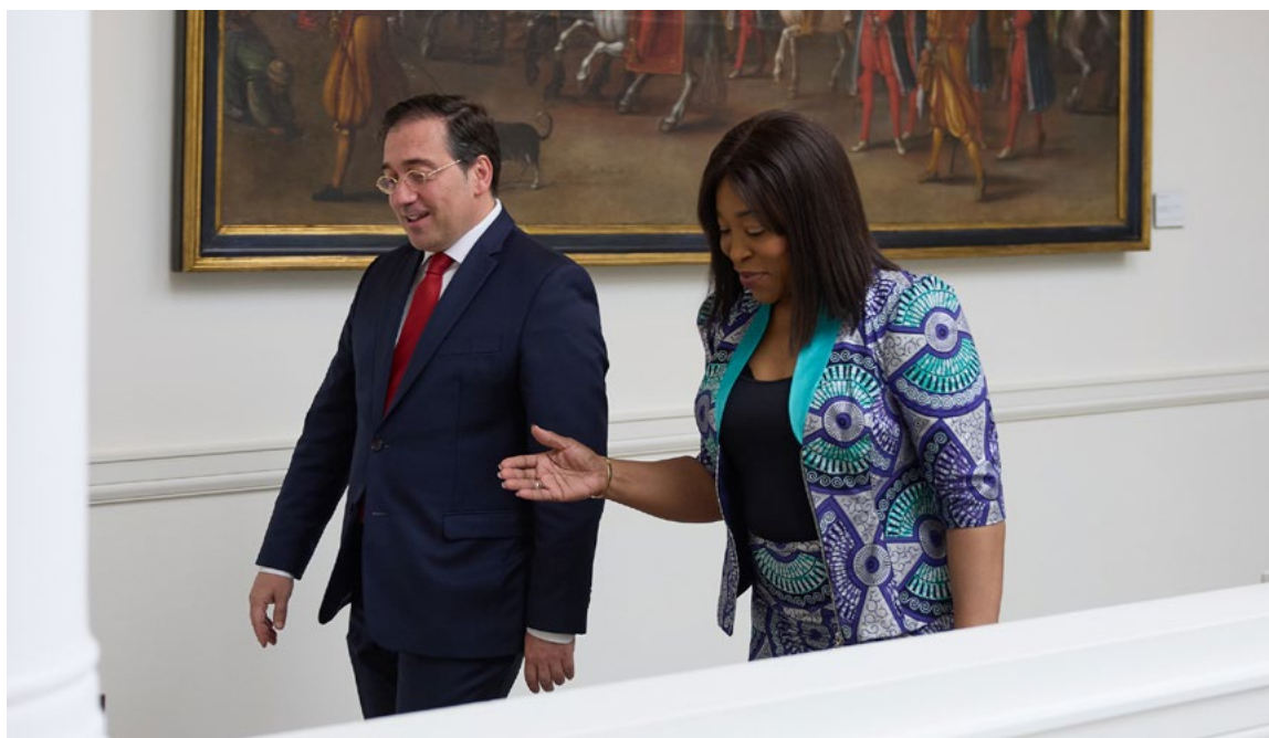
Encuentro entre el ministro de Asuntos Exteriores y la ministra Asuntos Exteriores e Integración Regional de Ghana. Madrid, 16 de julio.

Consolidando el compromiso de España con el multilateralismo, se aprobó una contribución voluntaria para la formación en español de sus