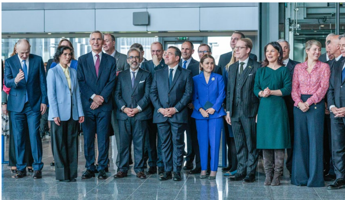
75º aniversario de la OTAN. Bruselas, 4 de abril.

La guerra de agresión contra Ucrania ha supuesto un fortalecimiento del compromiso aliado con la disuasión y defensa colectiva. Este compromiso, renovado en el Concepto Estratégico de Madrid, supone para nuestro país la participación activa con presencia militar en el flanco este, especialmente con el despliegue de fuerzas terrestres en Letonia, la Policía Aérea del Báltico y la Policía Aérea Reforzada (Bulgaria y Rumanía). La Guardia Civil participó en la Misión de la OTAN en Irak (NM-I), liderada hasta mayo de 2024 por el teniente general español, José Antonio Agüero así como en la Operación F-E SVK, en Eslovaquia.