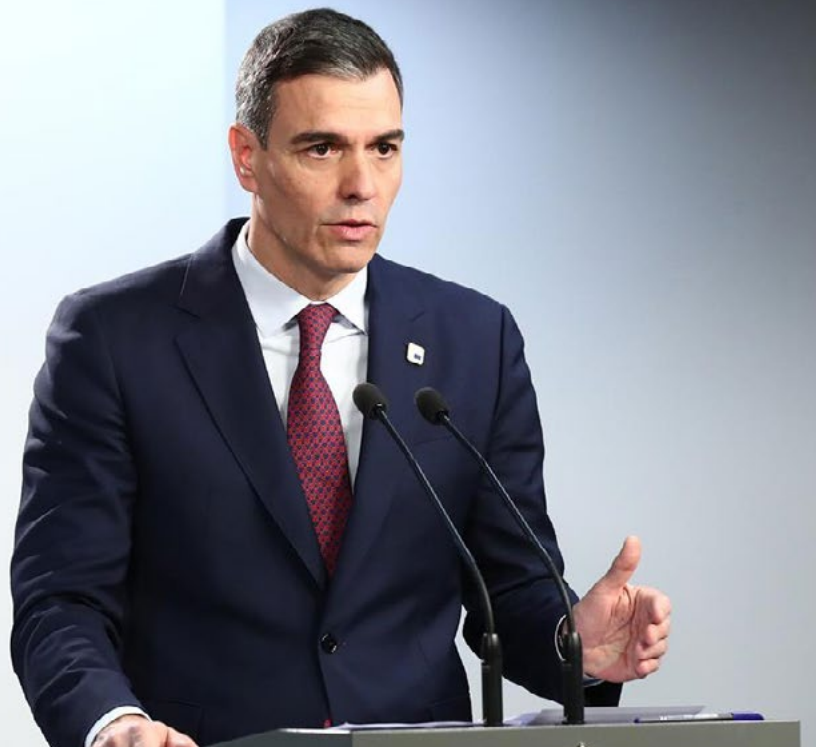
El Presidente de Gobierno en la Representación Permanente de España en la Unión Europea.

y ha apoyado en el seno de la UE los sucesivos paquetes de sanciones contra Rusia. A lo largo de 2024, el ministro de Asuntos Exteriores mantuvo cuatro reuniones bilaterales con su homólogo ucraniano para intercambiar información y reafirmar este respaldo. Igualmente, España impulsa los esfuerzos de global outreach frente a la propaganda y desinformación rusa para defender la paz en Ucrania, especialmente en América Latina y Caribe.