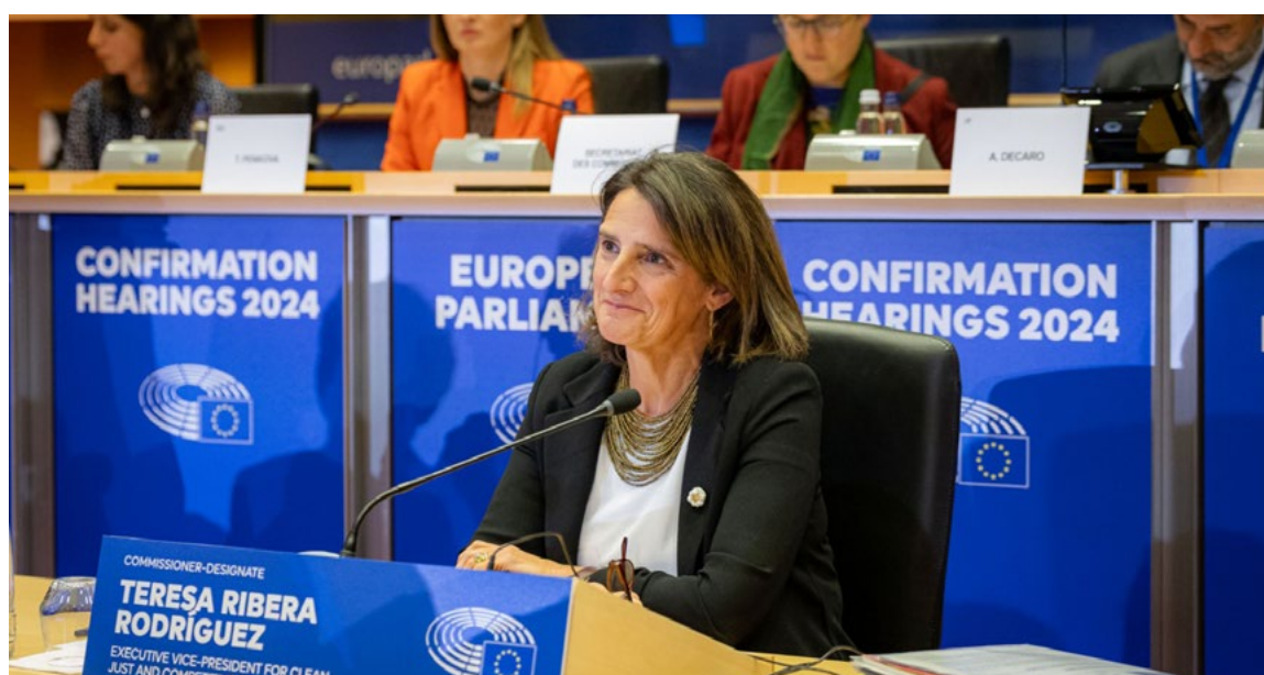
La vicepresidenta ejecutiva para una Transición Limpia, Justa y Competitiva de la UE durante la audiencia de confirmación del Parlamento Europeo, 12 de noviembre.

Finalmente, en cuanto al pilar social , España ha seguido impulsando iniciativas para proteger los derechos laborales a nivel europeo. Como hito en 2024 cabe destacar la aprobación del