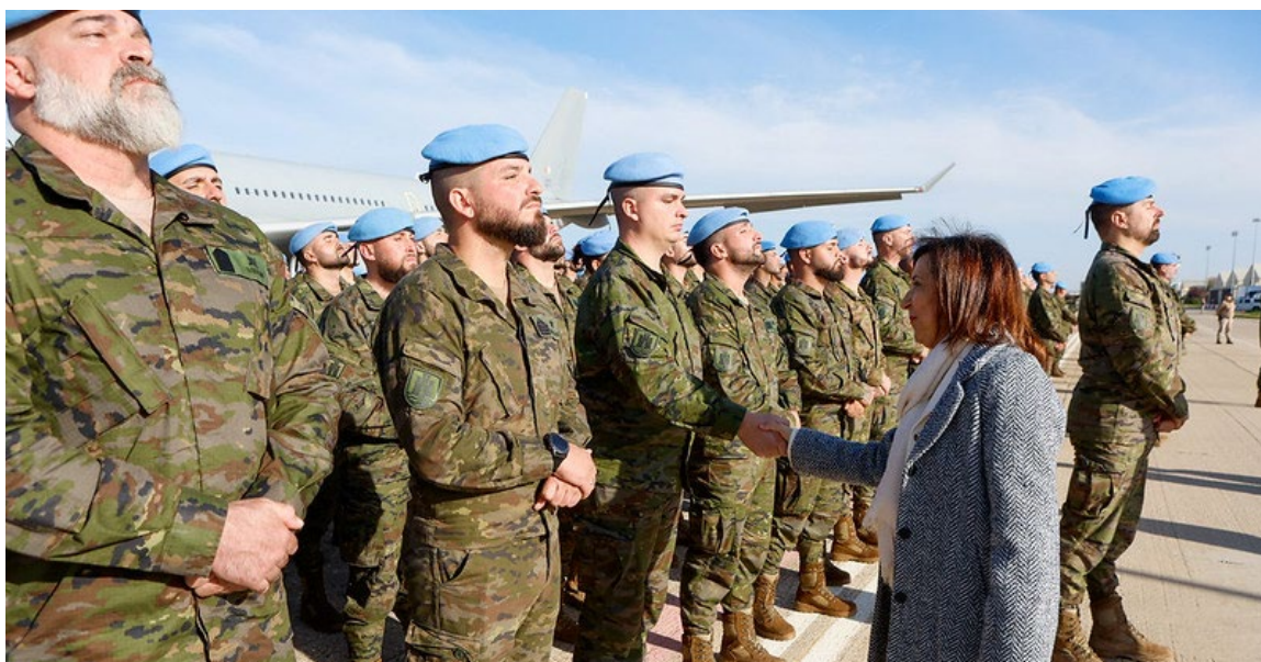
La ministra de Defensa despide al personal integrante de la segunda rotación del contingente que toma el relevo de la Operación «Libre Hidalgo» en Líbano. Base Aérea de Torrejón, 17 de noviembre de 2024.

El 21 octubre tuvo lugar la XIII Comisión Mixta con Irak, celebrada en Bagdad, centrada en profundizar la cooperación económica bilateral. Es-