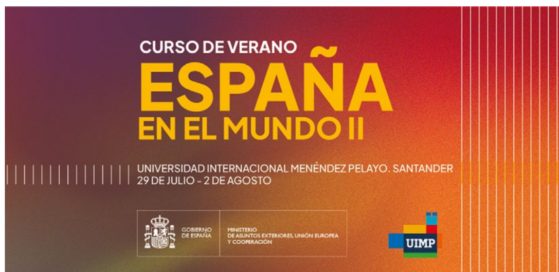
Curso de verano “España en el Mundo II”, celebrado en el Palacio de la Magdalena de Santander entre el 29 de julio y el 2 de agosto.

Además, la coordinación de programas lingüísticos sigue siendo una prioridad, incluyendo el programa de doble titulación de Bachillerato y Baccalauréat con Francia, el Programa Educati-