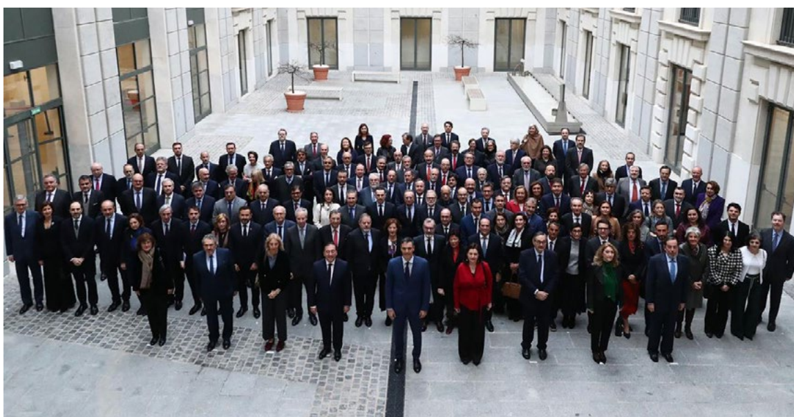
Conferencia de Embajadores y Embajadoras en la sede del ministerio de Asuntos Exteriores, Unión Europea y Cooperación, 10 de enero.

La Estrategia de Acción Exterior establecía entre sus objetivos el refuerzo de los mecanismos de coordinación entre embajadas a través de una conferencia anual de Embajadores y Embajadoras de España . En su edición de 2024, esta fue inaugurada por el presidente del Gobierno y clausurada por S. M. el Rey, contando con la participación de cuatro ministros, el director del Instituto Cervantes, el director de la AECID y los Embajadores de España, así como del secretario general de la SEGIB (Secretaría General Iberoamericana), Andrés Allamand.