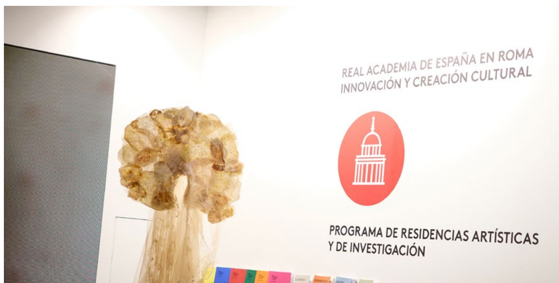
Participación de la Academia de España en Roma, 43ª edición de ARCOMadrid 2024, a través del stand de AECID/MAEUEC.

Los museos estatales han desempeñado un papel fundamental en la diplomacia cultural, con participación en el Programa Ibero museos y el préstamo de 264 piezas para exposiciones