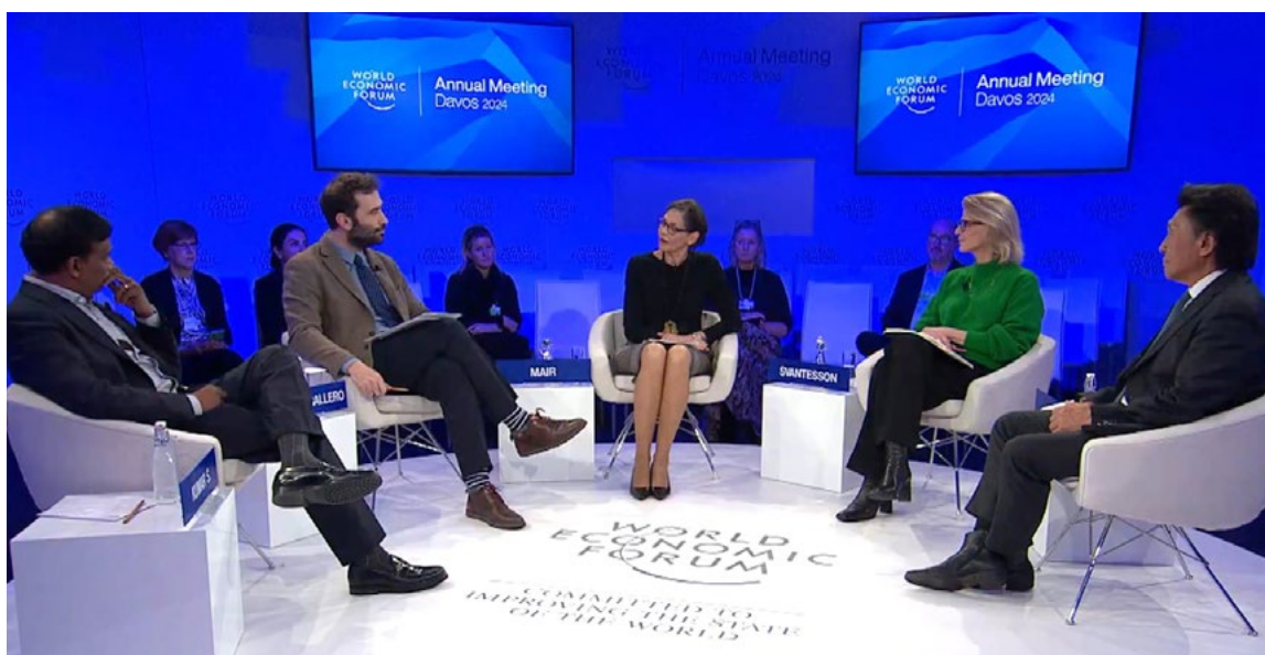
El ministro de Economía, Comercio y Empresa, en el Foro Económico de Davos, 17 de enero.

En el plano multilateral, España participó activamente en el Grupo de Trabajo de Investigación e Innovación del G20, contribuyendo a la definición de una estrategia para fomentar la innovación abierta. En el marco de la OCDE, junto con Estados Unidos y Reino Unido, lanzó el Global Forum on Technology , centrado en el desarrollo de neurotecnologías. Además, la Global Partnership on Artificial Intelligence (GPAI) evolucionó hacia una asociación integrada con la OCDE, reuniendo a 44 países en igualdad de condiciones para promover el uso responsable de la inte-