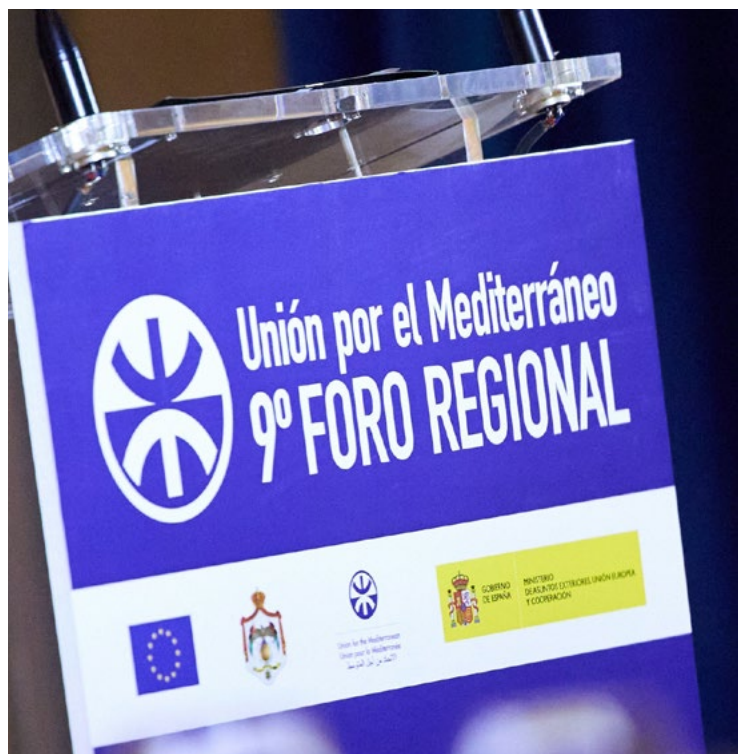
9º Foro Regional de la Unión Por el Mediterráneo.

En relación con los Estados Unidos , y en un contexto impredecible, España ha contribuido a definir la estrategia de respuesta de la UE.