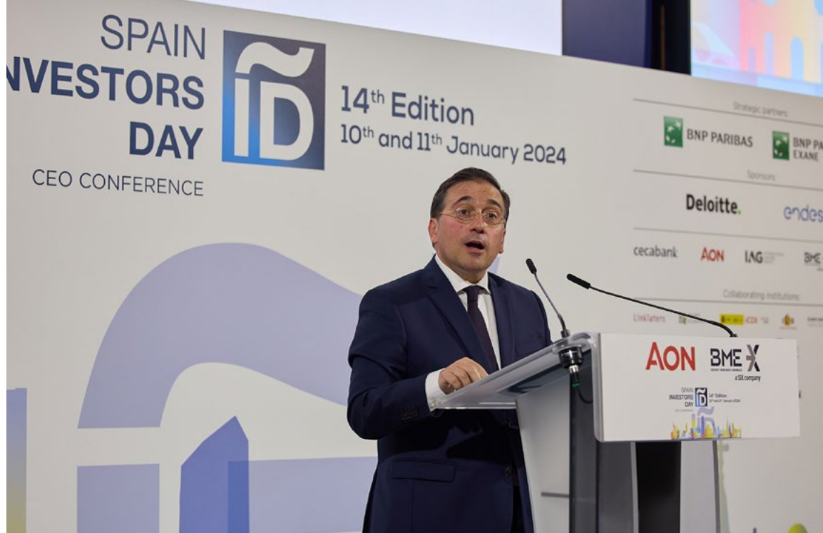
El ministro de Asuntos Exteriores, Unión Europea y Cooperación en la Cena Spain Investors Day en Madrid, 10 de enero.

guimiento activo de la red de Casas. También se ha participado en el Foro de Marcas Renombradas de España y se ha cooperado con entidades público-privadas como la Cámara de Comercio, CEOE y el Club de Exportadores.