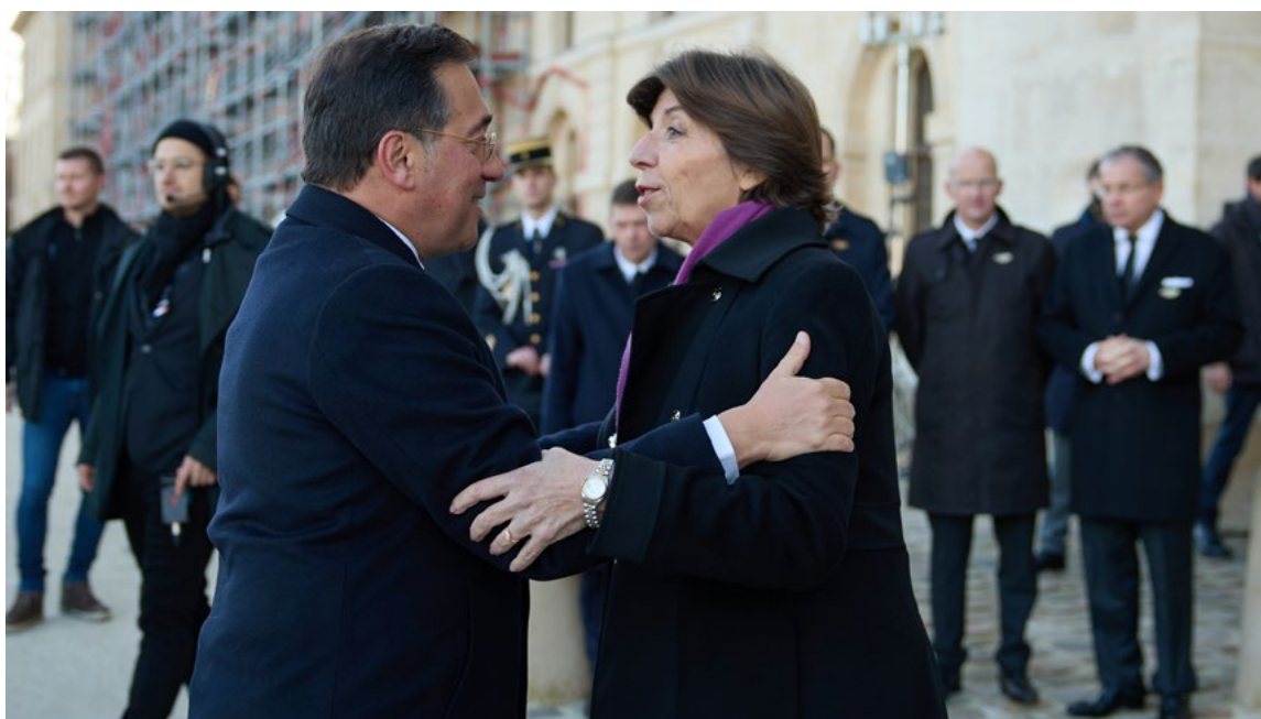
Homenaje a Jacques Delors. Bruselas, 5 de enero.

España ha seguido defendiendo el respeto al Estado de Derecho y las libertades en todos los países de la Unión, bastión innegociable del proyecto europeo que ha cobrado nueva relevancia en los debates internos y sobre el que España reafirma su compromiso. Se ha cooperado estrechamente con la Comisión Europea en la elaboración del capítulo de España del Informe anual de Estado de Derecho. En 2024, partici-