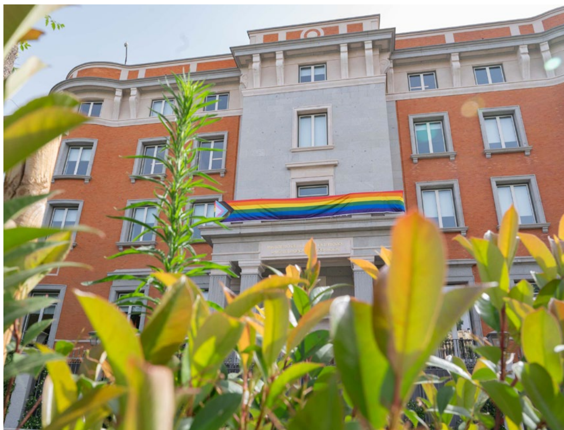
Sede del MAUC, compromiso con los derechos del colectivo LGTBIQ+.

España ha seguido promoviendo los derechos de las personas con discapacidad , destacando la participación en la 17ª Conferencia de Estados Parte de la Convención de los Derechos de las Personas con Discapacidad, así como en el Programa Iberoamericano de Discapacidad.