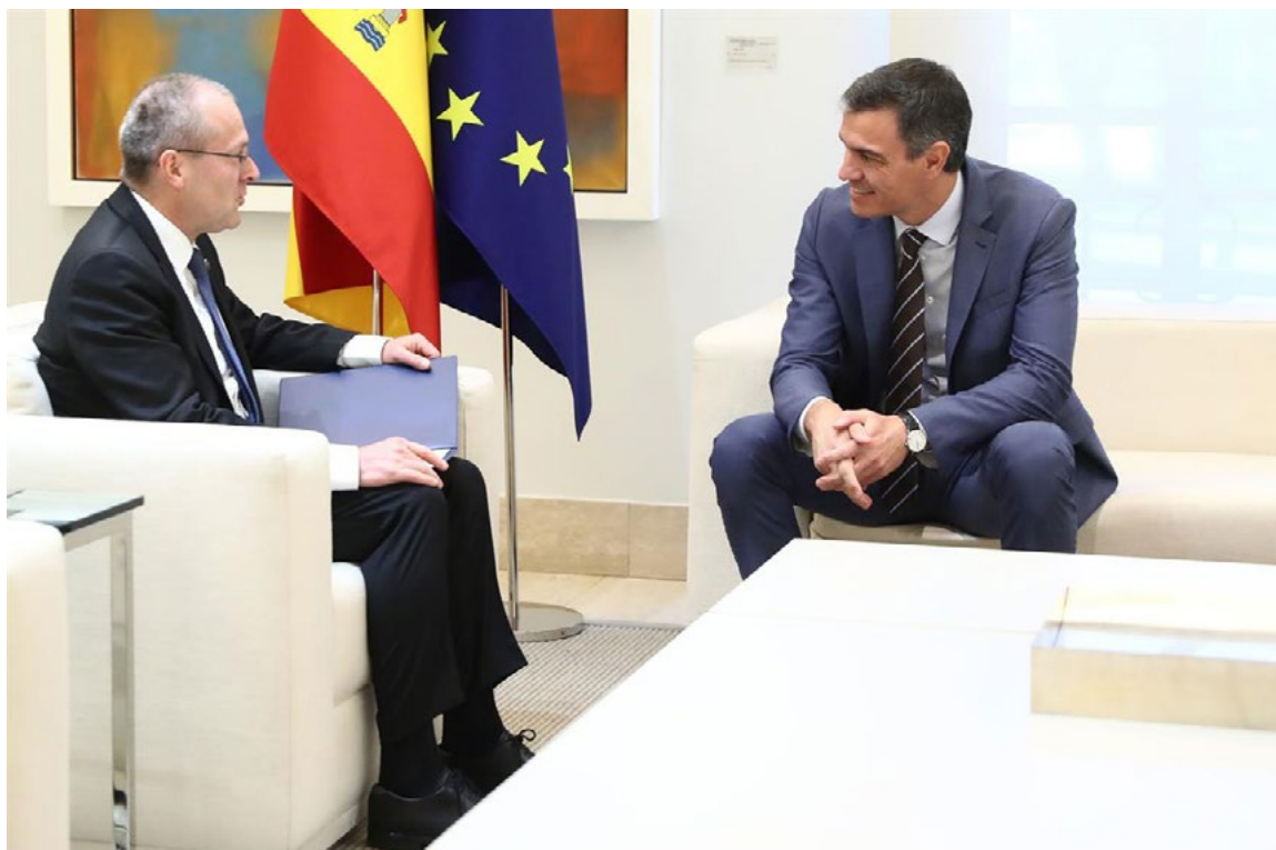
El presidente del Gobierno y el director regional de la OMS para Europa, Hans Kluge. La Moncloa, 3 de junio.

España defiende el carácter central de la OMS en la protección de la salud global. En este sentido, durante la 77ª reunión de la Asamblea Mundial de la Salud (mayo de 2024), se logró la adopción de enmiendas clave al Reglamento Sanitario Internacional , reforzando la preparación, la vigilancia y la acción frente a emergencias de salud pública, incluidas las pandemias.