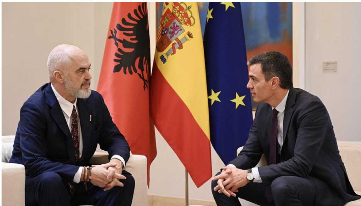
El presidente del Gobierno recibe a Edi Rama, primer ministro de la República de Albania. La Moncloa, 23 de enero.

así como de los ministros de Asuntos Exteriores, español y británico. El objetivo sería alcanzar un acuerdo que permitiera la libre circulación de personas y mercancías entre el Campo de Gibraltar y Gibraltar. El acuerdo ofrecería una nueva perspectiva de desarrollo y prosperidad compartida para toda la región. También abriría una nueva era en la relación global de España con Reino Unido, un socio clave.