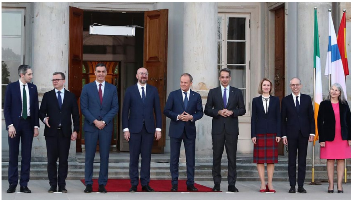
Reunión en Varsovia (Polonia) sobre la Agenda Estratégica de la UE, 11 de abril.

en el acceso a medicamentos seguros, eficaces y asequibles, mejorar la seguridad de suministro y fomentar la innovación y la competitividad reduciendo las cargas regulatorias.