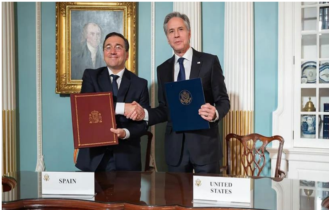
El ministro de Asuntos Exteriores, Unión Europea y Cooperación con su homólogo estadounidense en la firma del Memorando de Entendimiento sobre Desinformación. Washington, 10 de mayo.

Cabe destacar la celebración de la III reunión del Grupo de Trabajo España-Estados Unidos sobre Centroamérica , que tuvo lugar el 2 de abril en la Casa América en Madrid, y la IV reunión del Grupo de Trabajo España-Estados Unidos sobre Centroamérica , celebrada el 5 de diciembre en el Departamento de Estado.