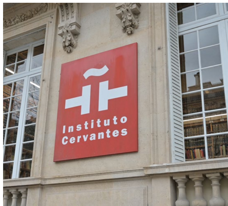
Fachada del Instituto Cervantes de París.

La Acción Educativa Exterior (AEE) del Ministerio de Educación, Formación Profesional y Deportes continúa siendo una herramienta clave de España para promover la lengua y la cultura españolas en el mundo. En 2024, se ha avanzado en la redistribución y refuerzo de la red de