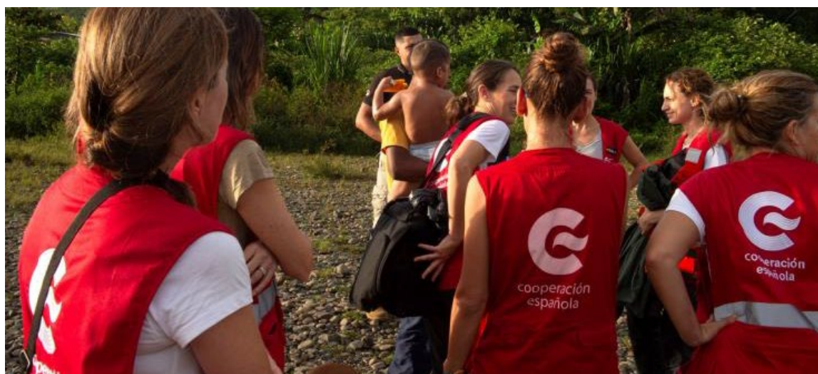
Equipo START de la AECID en Panamá.

En el marco de la UE, España ha tenido una participación activa a través del enfoque Team Europe Initiatives (TEI) o la estrategia Global Gateway . En 2024, la AECID movilizó 2.095 millones de euros en 61 TEI (43 nacionales, 16 regionales, 2 globales) con una apuesta decidida por las temáticas de pacto verde, desarrollo humano y crecimiento económico y empleo. De ellos, 1.400 millones de euros se destinaron a América Latina y el Caribe, y 600 millones de euros a África y Asia. Destaca especialmente la apuesta decidida que se ha realizado por la TEI Regional Green Transition en América Latina, con 340 millones de euros o Inclusive and Equal Societies , con 350 millones de euros. Durante el segundo semestre de 2024, España reforzó los trabajos para el diseño de un sistema integral de la Coherencia de las Políticas Públicas para el Desarrollo Sostenible (CPDS).