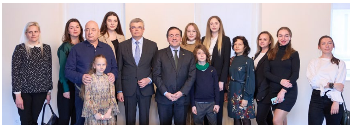
Encuentro con ciudadanos refugiados ucranianos en la sede del MAUC. Madrid, 27 de febrero.

Nuestro país está firmemente comprometido con el reconocimiento y el ejercicio del derecho a la protección internacional, y trabaja para adaptar el sistema de atención y acogida de personas migrantes y solicitantes de protección internacional a los retos actuales. En enero se adoptó el Programa Nacional de Reasentamiento de Refugiados en España (PNR) que contemplaba el compromiso de reasentamiento en España de hasta 1.200 personas refugiadas a lo largo de 2024. Este programa busca ofrecer vías seguras de migración para personas refugiadas, con un enfoque especial en la infancia y adolescencia para garantizarles acceso a una educación de calidad. A pesar de que el conflicto en El Líbano ha condicionado la ejecución del programa, en 2024 fueron finalmente reasentadas un total de 632 personas (516 procedentes del Líbano y 116 procedentes de Costa Rica). Además, a través de la vía complementaria y adicional para autorizar la llegada de personas refugiadas a la que se refiere el Acuerdo del Consejo de Ministros, de 3 de mayo de 2023, se trasladaron 110 personas refugiadas a España. En 2024, España ha participado, en el marco de la UE, en el Comité de Alto Nivel de Reasentamiento y Admisión Humanitaria.