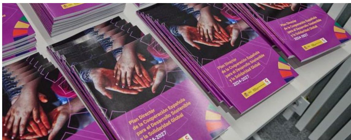
Plan Director de la Cooperación Española 2024-2027.

En un contexto marcado por una creciente crisis de solidaridad global y desafíos cada vez más interconectados, España ha reafirmado su compromiso con la cooperación internacio-