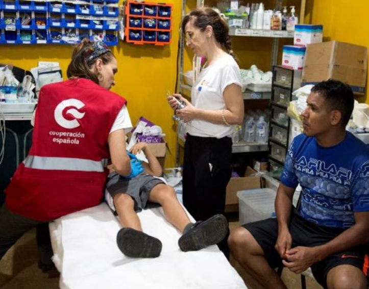
Misión de acción humanitaria del equipo START en el Darién panameño.

UNDRR o la FICR), así como la importante presencia de ONGs españolas y la sólida capacidad de las organizaciones locales, que permiten un mayor apoyo a la localización.