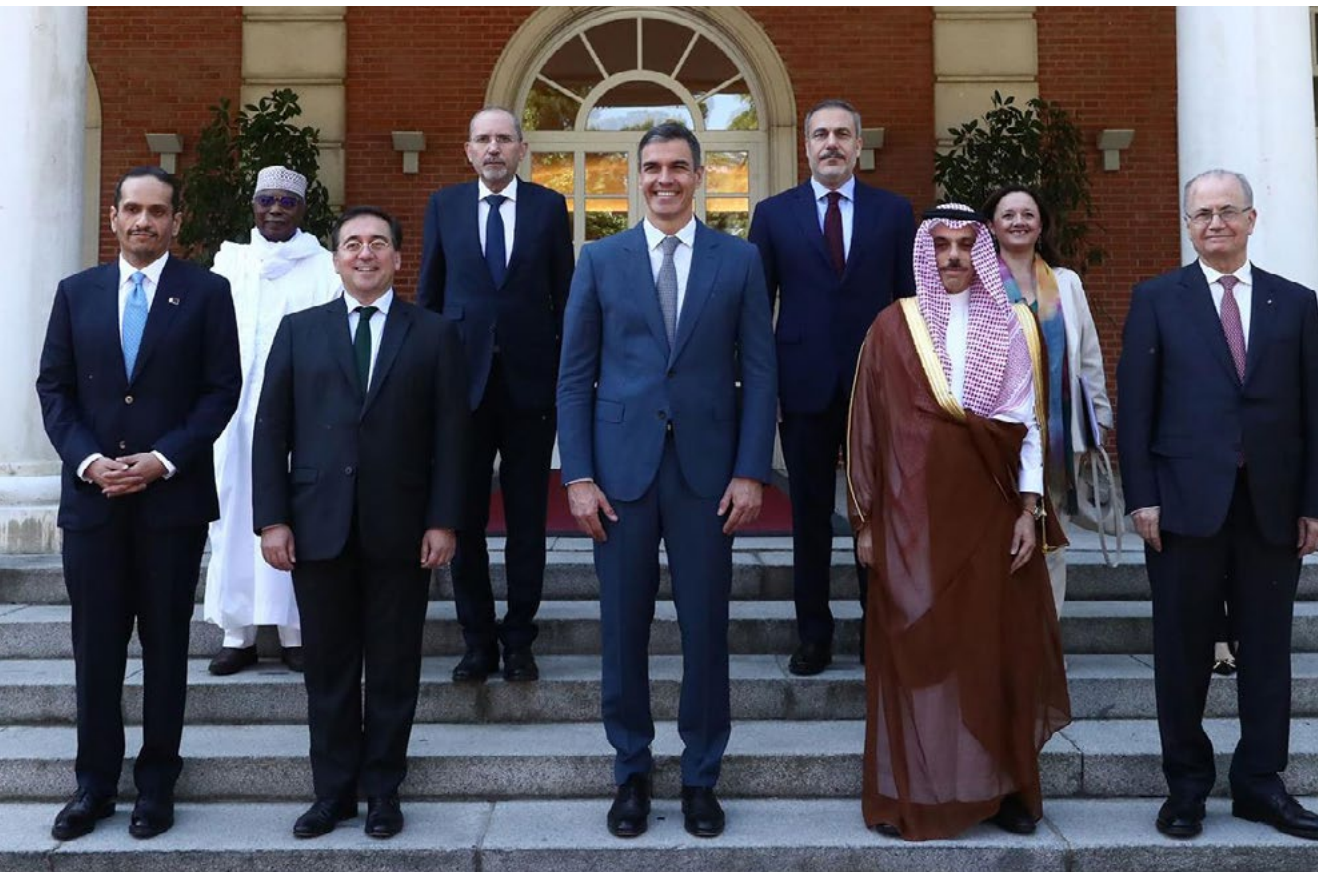
Comité ministerial árabe-islámico. La Moncloa, 29 de mayo.

Desde el inicio de la crisis, España ha defendido una perspectiva de paz creíble, y duradera. Para ello, España ha liderado las iniciativas de la comunidad internacional para hacer avanzar la implementación de la solución de los dos Estados, base de la Declaración de Nueva York, endosada por la mayoría de la Asamblea General de Naciones Unidas, incluidos los países de la UE, los miembros de la Liga Árabe y los miembros de la Organización para la Cooperación Islámica. España ha impulsado estos esfuerzos también en el seno de la Alianza Global para la implementación de la solución de los dos Estados.