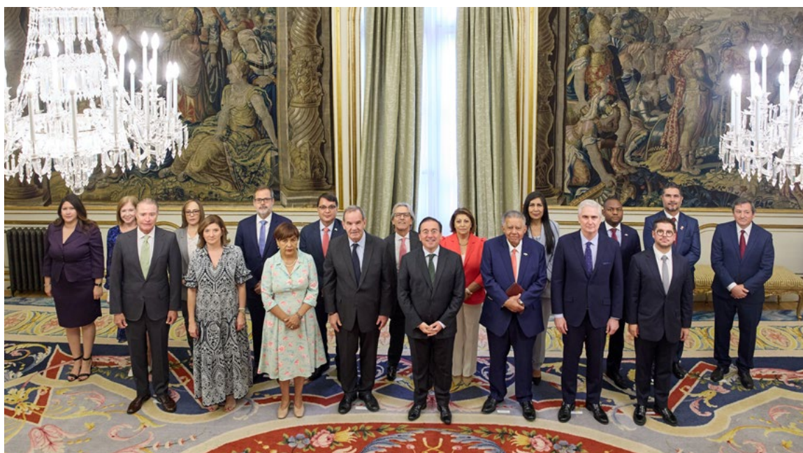
Reunión con Embajadores Iberoamericanos. Madrid, 24 de julio.

Asimismo, en el marco de esta Cumbre, y con el respaldo de todos los Estados iberoamericanos, España asumió la Secretaría Pro Témpore para organizar la XXX Cumbre Iberoamericana , que se celebrará en Madrid el próximo año 2026.