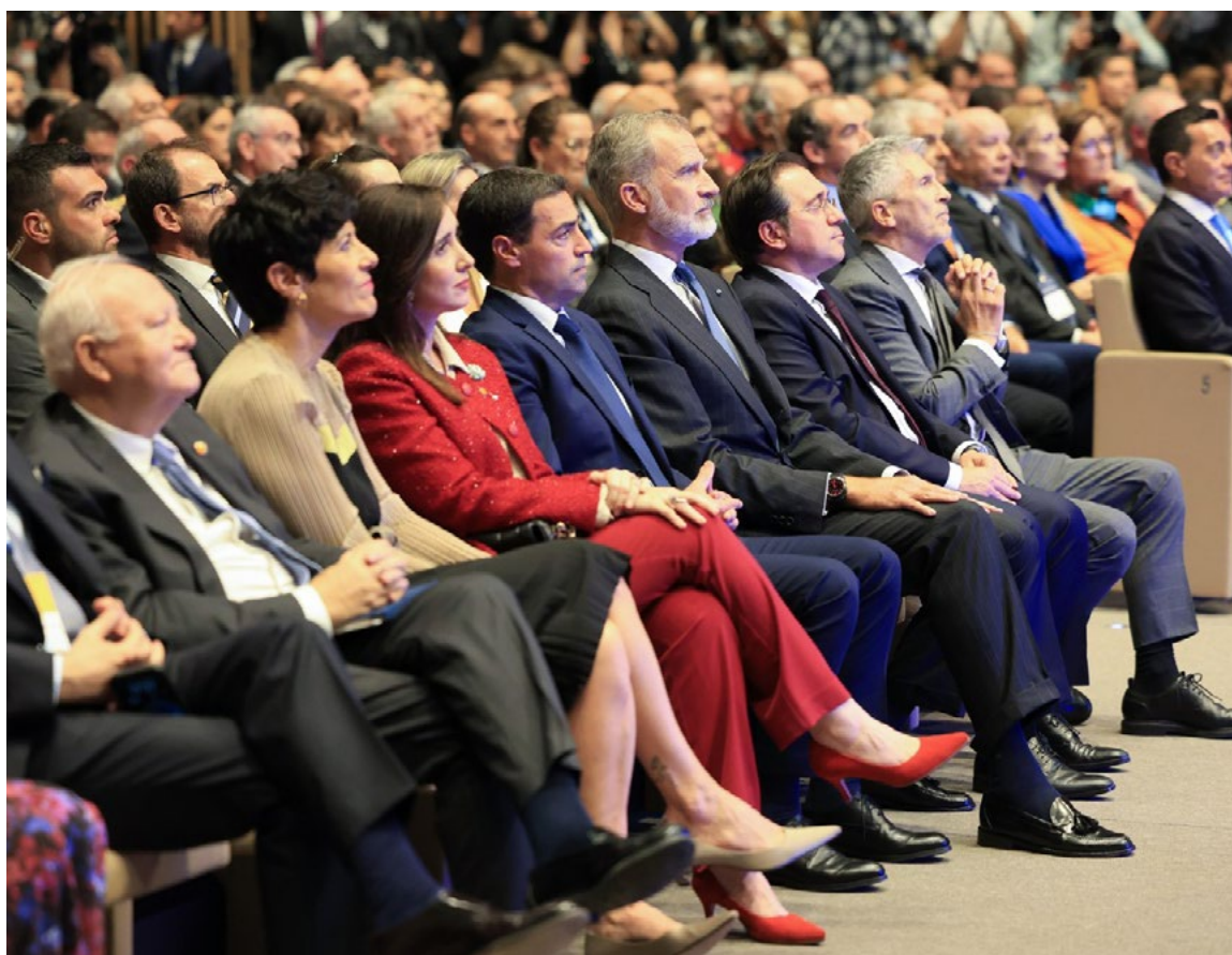
Conferencia Internacional de Naciones Unidas sobre Víctimas del Terrorismo. Vitoria-Gasteiz, 8 de octubre.

y el estallido del conflicto armado en la Franja de Gaza en 2023, las misiones de disuasión y defensa y la proyección de estabilidad de las Fuerzas Armadas son herramientas insustituibles para profundizar en la búsqueda y mantenimiento de la paz. Las misiones de las Fuerzas Armadas en el exterior, junto a nuestros socios y aliados, en cumplimiento de los compromisos asumidos, se realizan conforme a los principios de responsabilidad y solidaridad e integrando la seguridad humana como elemento esencial en la prevención de conflictos, de conformidad con lo que establece la Directiva de Defensa Nacional vigente y el marco de la Carta de Naciones Unidas.