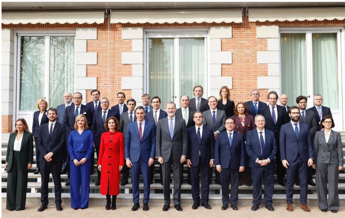
XXXIV sesión ordinaria del Patronato de la Fundación Carolina. Madrid, 29 de enero.

Medio para estudios reglados, estancias de investigación y formativas en España, y 95 becas a ciudadanos de América Latina para realizar estudios de posgrado en España.