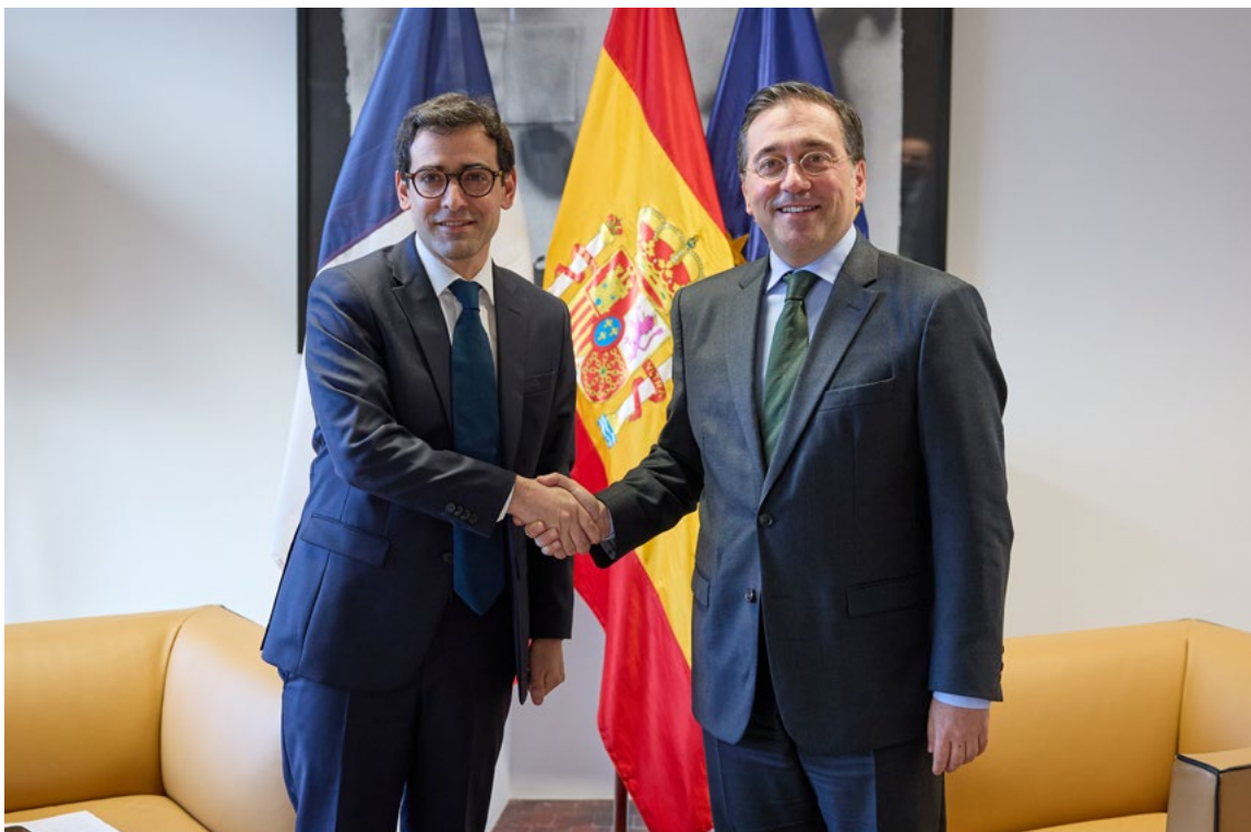
Encuentro del ministro de Asuntos Exteriores español y su homólogo francés con ocasión de la celebración del Consejo de Asuntos Exteriores de la UE. Bruselas, 22 de enero.

del Consejo de la UE de 2023 había dejado muy avanzados. Entre ellos, el paquete legislativo de reforma del marco de gobernanza económica , para la coordinación de las políticas económicas y supervisión presupuestaria multilateral en la UE; el acuerdo sobre el paquete legislativo de lucha contra el blanqueo de capitales y financiación del terrorismo ; o el acuerdo relativo al Reglamento sobre las normas financieras aplicables al presupuesto general de la Unión .