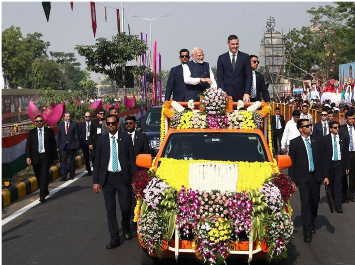
El Presidente de Gobierno y el primer ministro Narendra Modi durante el viaje oficial a la India, 28 de octubre.

UE-Indopacífico, con su homólogo de Pakistán Jalil Jilani. Durante el segundo semestre, el ministro de Asuntos Exteriores, Unión Europea y Cooperación también mantuvo encuentros con sus homólogos de India y Corea , Subrahmanyam Jaishankar y Cho Tae-yul, durante la Semana Ministerial de Naciones Unidas en septiembre; y de Bangladesh , Touhid Hossain, en Cascais en noviembre durante el Foro Global de la Alianza de Civilizaciones. Asimismo, culminó la negociación del Acuerdo entre España y el Gobierno de India sobre cooperación y asistencia mutua en materia aduanera, hecho en Vadodara el 28 de octubre de 2024.