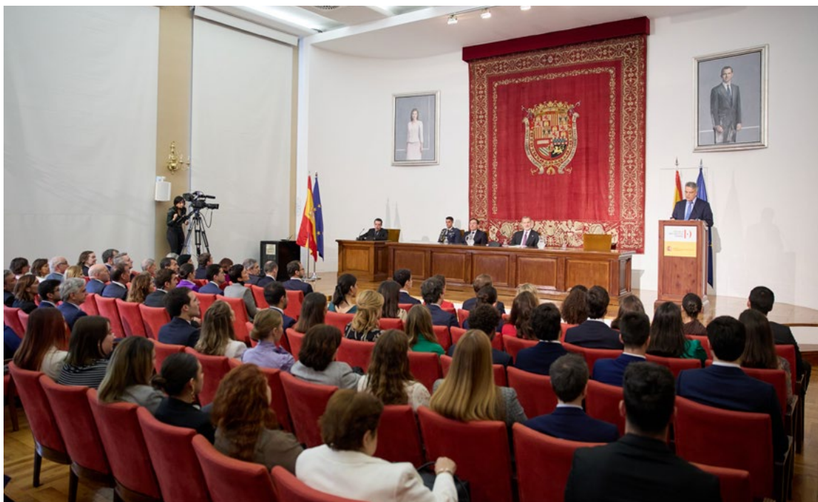
El ministro de Asuntos Exteriores, Unión Europea y Cooperación. Entrega de despachos Escuela Diplomática, 2 de abril.

bre las elecciones presidenciales en EE. UU., el hidrógeno (sostenibilidad y geoestrategia), la desglobalización y la seguridad económica, las relaciones entre EE. UU. y China o la inteligencia artificial; las jornadas sobre terrorismo yihadista y conferencias sobre los Balcanes como parte de la región mediterránea o la política exterior de los EE. UU. en Oriente Medio.