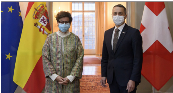
La anterior ministra de Asuntos Exteriores, Unión Europea y Cooperación es recibida en la Maison de Watteville por el entonces consejero Federal Ignazio Cassis .- Berna, 20 de noviembre de 2020.

15/16-02-2016, asistencia en Ginebra de la defensora del Pueblo, Dª Sole-