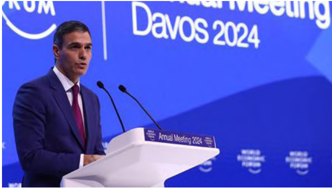
El presidente de Gobierno, D. Pedro Sánchez, durante su intervención en el Foro Económico Mundial..- Davos (Suiza) 17.01.2024

05-10-2023 , El Presidente CF D. Alain Berset viajó a Granada para participar en la III Cumbre de la Comunidad Política Europea, organizada por España.