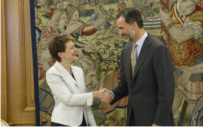
La anterior presidenta de turno de la Confederación, D a Simonetta Sommaruga, con S.M. el rey D. Felipe VI, durante su encuentro en Madrid el día - 6 de julio de 2015

Defensa hasta el 1% del PIB y, tras intensos debates, se ha fijado como fecha para alcanzar ese objetivo el año 2032.