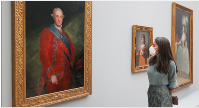
Doña Letizia ante el retrato de Carlos IV.- Fundación Beyeler. Basilea (Suiza), 08.10.2021.