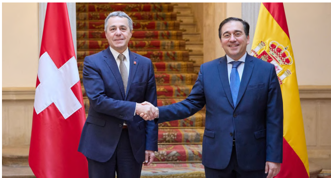
Visita a Madrid del ministro de Asuntos Exteriores, D. Ignazio Cassis, para reunirse con su homólogo español, D. José Manuel Albares Bueno, antes del inicio de la Presidencia española del Consejo de la UE 05.06.2023.

tria Agrícola Suiza (FENACO) y miembro del Consejo de Administración de la compañía de seguros de edificios del cantón de Vaud.