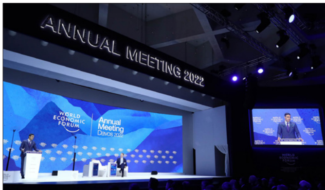
El presidente del Gobierno, Pedro Sánchez, en la Reunión Anual del Foro Económico Mundial.-Suiza (Davos) 25/05/2022.-foto: Pool Moncloa/Fernando Calvo