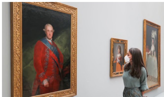
Doña Letizia ante el retrato de Carlos IV.- Fundación Beyeler. Basilea (Suiza), - 08.10.2021.

En cuanto al turismo, en 2022 visitaron España 1,65 millones de personas con residencia en Suiza, acercándose de nuevo a los 1,8 millones que