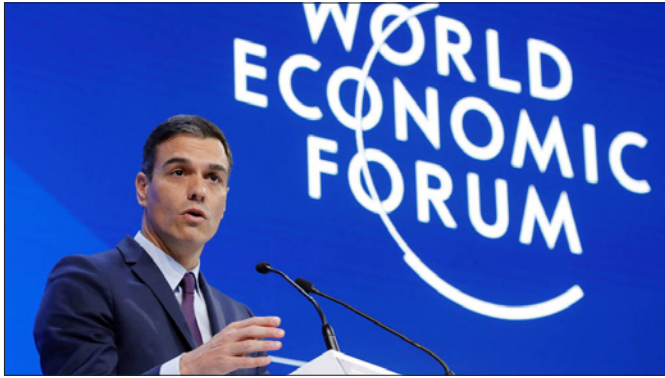
El presidente de Gobierno, D. Pedro Sánchez, durante una sesión plenaria celebrada en el ámbito del Foro Económico Mundial 2019 en Davos (Suiza) el 23 de enero de 2019.