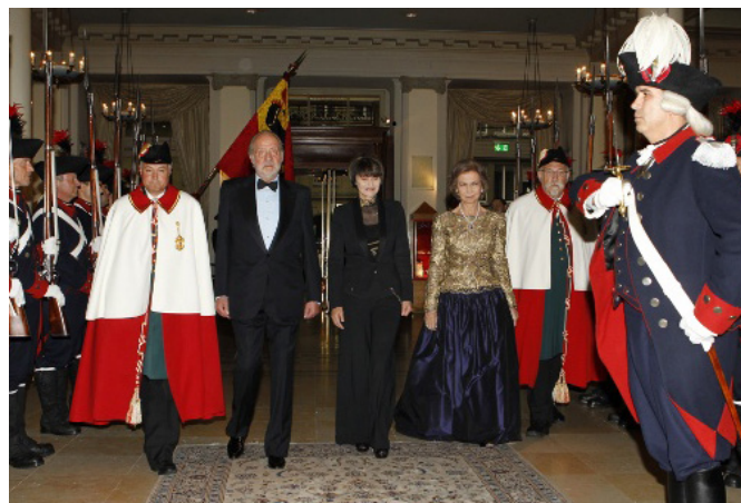
SSMM los Reyes, junto a la entonces presidenta de la Confederación Micheline Calmy-Rey durante su visita a Suiza en mayo de 2011

El pasado mes de mayo el Consejo Federal suizo anunció que no firmaría un Acuerdo Institucional que se estaba negociando desde hace 7 años con Bruselas y cuya finalidad era actualizar sus relaciones en beneficio mutuo, otorgándoles mayor previsibilidad. Tanto la Comisión como los Estados miembros lamentaron esta decisión del gobierno suizo.