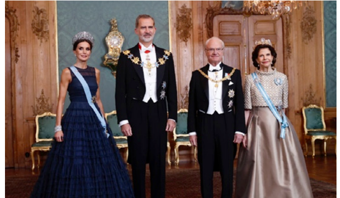
Sus Majestades los Reyes de España junto a Sus Majestades los Reyes de Suecia.- Estocolmo (Suecia), 23.11.2021.