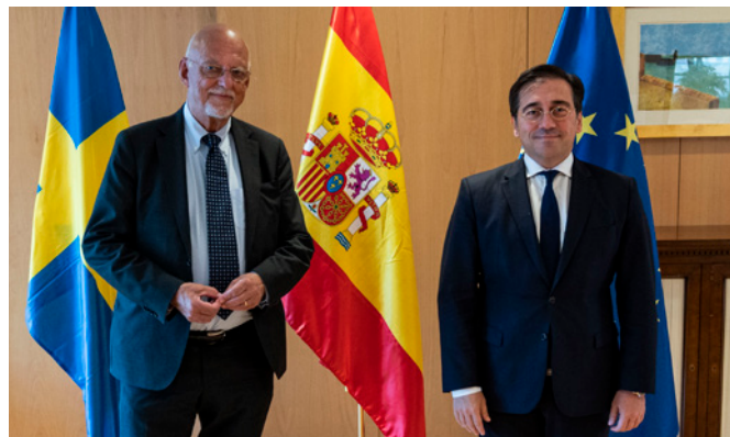
D. Hans Dahlgren, ministro para Asuntos Europeos sueco junto al ministro español D. José Manuel Albares.-Madrid 27/sep/2021.