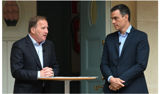
El presidente de Gobierno español, Pedro Sánchez, y el anterior primer ministro sueco, Stefan Löfven, comparecen ante los medios en la residencia vacacional de Harpsund (Suecia). -14 de junio de 2020.

- Ayuda militar y la reconstrucción de Ucrania. Bajo este epígrafe se sitúa la política sueca de cooperación al desarrollo y de comercio exterior (entendido