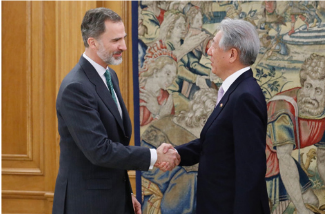
Su Majestad el Rey recibe el saludo del viceprimer ministro de Singapur y ministro coordinador para la Seguridad Nacional, Teo Chee Hean.-Palacio de La Zarzuela. Madrid, 12.03.2018.

En marzo de 2006 se rubricó en Singapur el Acuerdo de Transporte Aéreo entre España y Singapur.