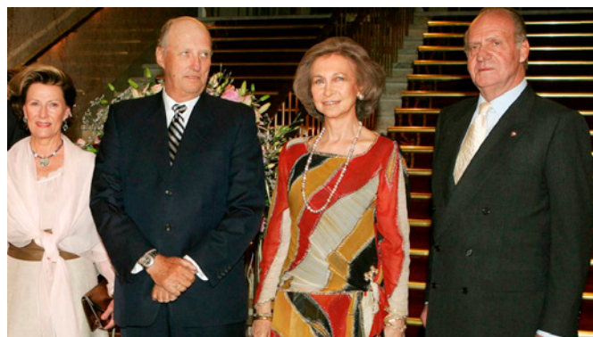
Visita a Oslo de SSMM Don Juan Carlos y Doña Sofía con motivo del 80º aniversario de los reyes de Noruega Harald y Sonia. Oslo, 10 de mayo de 2017