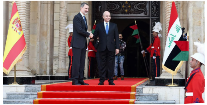
El presidente iraquí Barham Salih, junto al rey español Felipe VI en Bagdad, Irak.-30 de enero de 2019.

En 2015, se destinaron 1'5 millones de euros a Irak. Se apoyó al Comité Internacional de la Cruz Roja con un monto de 1.000.000 euros con el fin de responder al llamamiento de emergencias del CICR para dicho país, así como al Programa Mundial de Alimentos con 300.000 euros para dar asistencia de emergencia para la población afectada por el conflicto en Irak y a Cáritas España con 200.000 euros para dar respuesta de emergencia de refugio y agua, saneamiento e higiene, a población desplazada y de acogida especialmente vulnerable en Kirkuk.