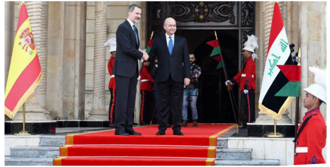
El presidente iraquí Barham Salih, junto a SM el rey Felipe VI en Bagdad, Irak.-30 de enero de 2019.

Junio de 2014 , visita España el gobernador civil de Bagdad. En noviembre del mismo año visita España una delegación del Ministerio de Medio Ambiente