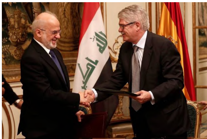
Encuentro entre Alfonso Dastis, anterior ministro de Asuntos Exteriores y de Cooperación y el entonces ministro de Asuntos Exteriores, Al Jaafari.- Mayo 2017 en Madrid.- (Photo by Burak Akbulut/Anadolu Agency/Getty Images)

(el 12,5% de los recursos hídricos de Iraq llegan de Irán). Irán, a su vez, se beneficia del mercado iraquí, al que exporta muchos productos y exige a Irak el control y desarme de los grupos de oposición iraní refugiados en el Kurdistán iraquí. La creciente influencia iraní y las complicadas relaciones con este país han generado reticencias en buena parte de la población iraquí hacia su vecino. El 11 de septiembre de 2024 el Presidente de Irán Masoud Pezeshkian realizó su primera visita de 3 días a Irak, una visita calificada de “histórica” por los dos países, que también incluyó la Región autónoma del Kurdistán y una misión comercial a Basora, centro económico del país. En la visita se firmaron una docena de MOUs y se reforzó el marco de seguridad en la frontera conjunta Irak-Irán.