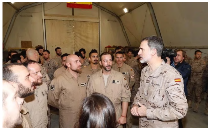
SM el Rey conversa con varios miembros del contingente español desplegado en Irak, Bagdad, 30.1.2019

Como receptor/inversor (flujos 2023/stock 2021): 91/99