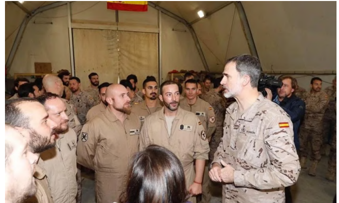
SM el Rey conversa con varios miembros del contingente español desplegado en Irak, Bagdad, 30.1.2019