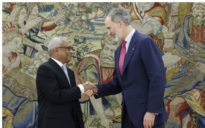
Su Majestad el Rey recibe el saludo del Presidente de la República de Cabo Verde, Sr. José María Pereira Neves.- Palacio de La Zarzuela. Madrid, 09.04.2024.