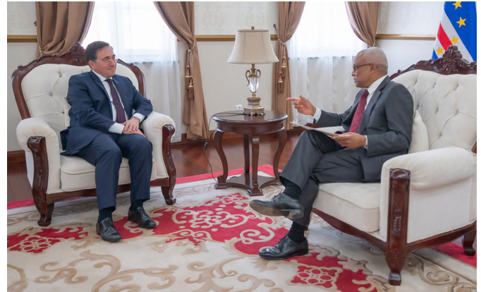
El ministro de Asuntos Exteriores, UE y Cooperación, Jose Manuel Albares, junto a su homólogo el ministro Rui Figueiredo.-Cabo Verde, 19 de junio de 2024.

Las elecciones legislativas celebradas el 20 de marzo de 2016 dieron una rotunda victoria por mayoría absoluta al MpD, hasta entonces en la oposición, obteniendo 40 sobre 72 escaños en la Asamblea Nacional y Ulisses Correia e Silva asumió el cargo de Primer Ministro. En las elecciones "autárquicas" (municipales) que se celebraron en octubre de 2020, el MpD mantuvo muchas de las alcaldías, pero perdió la de Praia y hubo un ascenso importante de la oposición de centro izquierda del PAICV.