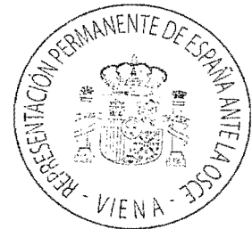
Cristóbal Valdés Valentín- Gamazo