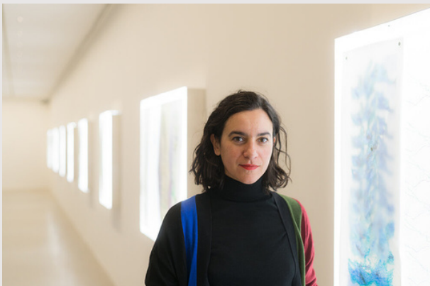
Claudia Pagès Rabal

Presentación del catálogo 5 de febrero | 18:00 MUMOK MUMOK Kino Museumsplatz 1 1070 Viena Más información