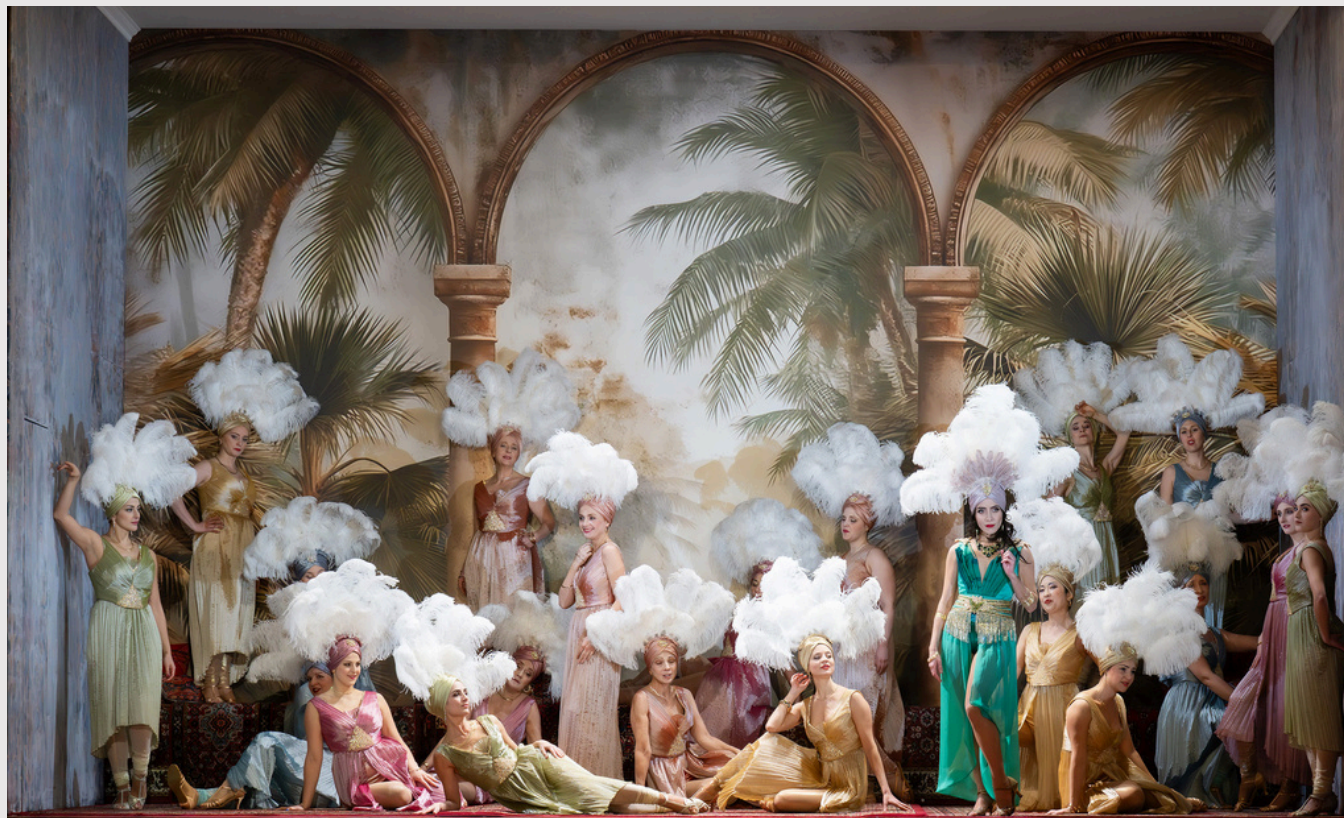
Benamor ©Monika-Rittershaus. Theater an der Wien