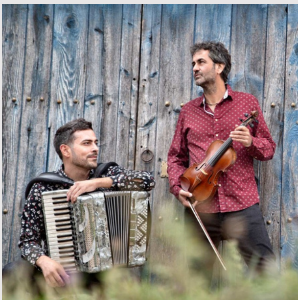
Fetén Fetén