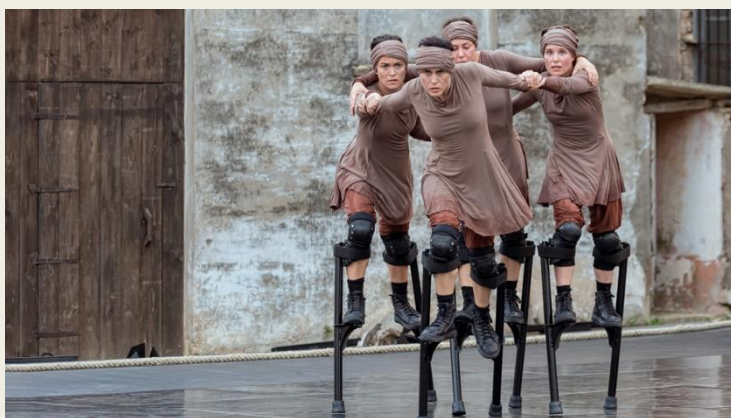
Con apoyo de esta embajada y AC/E