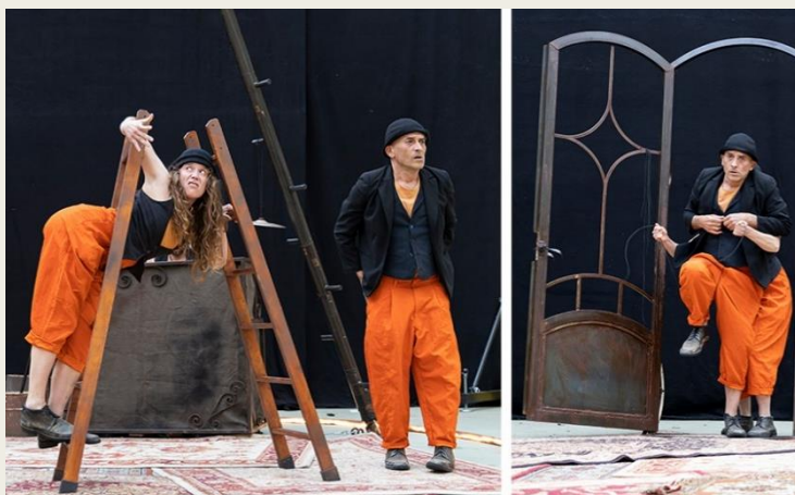
Con apoyo de esta embajada y AC/E