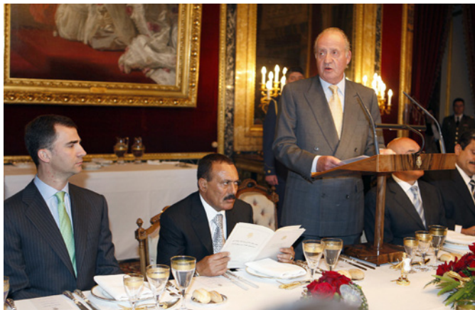
SM el rey Juan Carlos en el almuerzo ofrecido al entonces presidente de Yemen, Ali Abdullah Saleh, de visita oficial a España en enero de 2008.