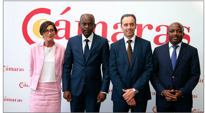
Encuentro entre el ministro de Asuntos Exteriores, D. Robert Dussey y delegación de Togo; el director del Consejo de Cámaras de Comercio, D. Javier Carretero y la Embajadora española en Togo, en Madrid.- 16 julio 2014