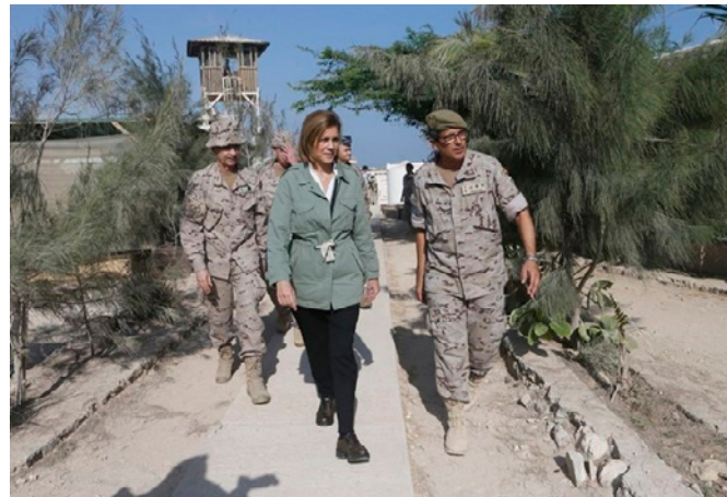
La entonces ministra de Defensa, D a María Dolores de Cospedal, visita el contingente español desplegado en la misión de entrenamiento EUTM-Somalia en Mogadiscio.- 23/02/2017.- @EuropaPress

Nació en Mogadiscio en 1962. Hijo de un funcionario del Gobierno, en 1982 ingresó en la Carrera Diplomática somalí y en 1985 fue destinado a la Embajada de Somalia en los Estados Unidos, donde amplió sus estudios y solicitó asilo después de la caída de Siad Barre en 1991. Tras obtener la nacionalidad estadounidense, ocupó diversos puestos en la Administración local y regional de los