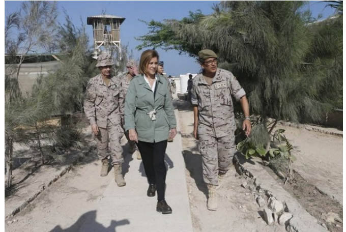
La entonces ministra de Defensa, D a María Dolores de Cospedal, visita el contingente español desplegado en la misión de entrenamiento EUTM-Somalia en Mogadiscio.- 23/02/2017.

Hassan Sheikh Mohamud nació en Jalalaqsi, (Somalia) en 1955. En 1978, se trasladó a Mogadiscio, donde estudió en la Universidad Nacional de Somalia, licenciándose en Tecnología,. Durante los primeros años de la gue-