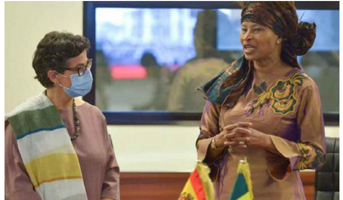
Encuentro entre la entonces ministra de Asuntos Exteriores, UE y Cooperación, Arancha González Laya, y su homóloga senegalesa, Aïssata Tall Sall –Senegal 22/11/2020.