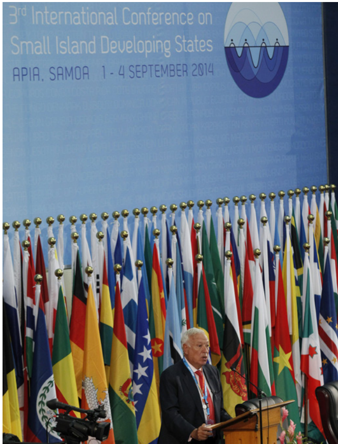
El anterior ministro de Asuntos Exteriores y de Cooperación, José Manuel García-Margallo durante la visita a Apia (Samoa) en septiembre de 2014, con motivo de la Conferencia de la ONU de los Pequeños Estados Insulares en Desarrollo.