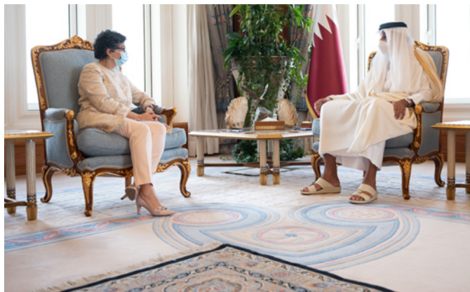
La anterior ministra de Asuntos Exteriores, UE y Cooperación, Arancha González Laya, se reúne con el emir de Qatar en Doha – Febrero 2021.