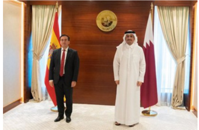
El ministro de Asuntos Exteriores, José Manuel Albares, con su homólogo de Qatar, jeque Mohamed bin Abdulrahman al Thani, durante su visita a Doha.-14/10/2021.-foto: Europa Press.