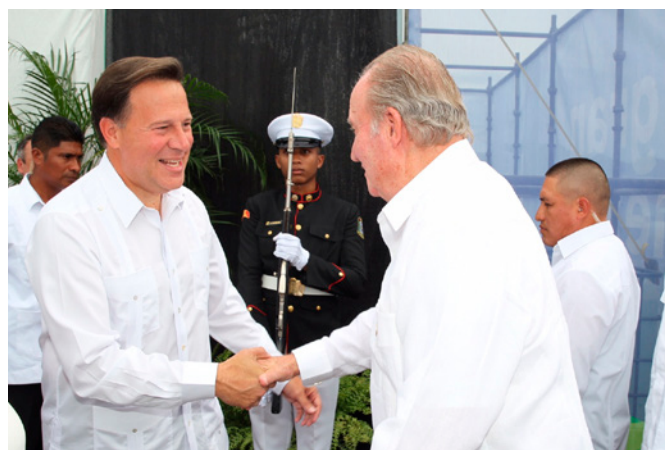
Su Majestad el Rey Don Juan Carlos recibe el saludo del entonces presidente de la República de Panamá, Juan Carlos Varela, a su llegada a las esclusas de Cocolí.-Panamá, 26.06.2016.