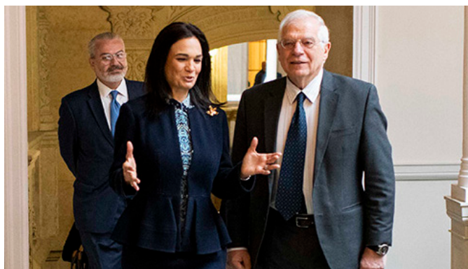
La entonces ministra de Relaciones Exteriores de Panamá Isabel de Saint Malo y su anterior homólogo Josep Borrell, en el Palacio de Viana. 24-04-2019.