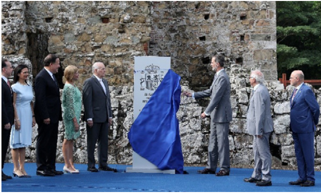
S.M. el Rey revela placa conmemorativa de su visita a Panamá Viejo en el acto conmemorativo del V Centenario de la fundación de Panamá. 30.06.2019".

Convenio para evitar la doble imposición en materia de impuestos sobre la renta y sobre el patrimonio y prevenir la evasión fiscal. Protocolo