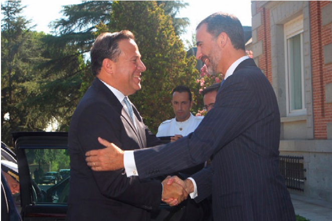
SM el Rey recibe al presidente de Panamá, Juan Carlos Varela, a su llegada al Palacio de La Zarzuela.- Madrid, 08.09.2014