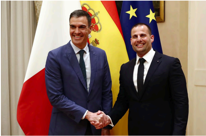
Reunión entre el presidente del Gobierno Pedro Sánchez y el primer ministro maltés Robert Abela.- La Valeta (Malta) 04/04/2023.