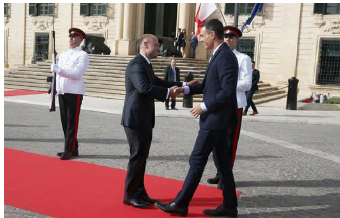
El presidente del Gobierno, entonces en funciones, Pedro Sánchez, saluda al anterior primer ministro de Malta, Joseph Muscat, a su llegada a La Valeta (Malta) para participar en la sexta Cumbre de países del sur de Europa, que reúne a los jefes de Estado o de Gobierno de Chipre, España, Francia, Grecia, Italia, Malta y Portugal. Junio 2019.

Las entidades locales (68 municipios, 54 Malta y 14 en Gozo) son el único nivel por debajo de la administración nacional.