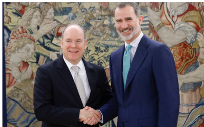
SM el Rey y Su Alteza el Príncipe Alberto II de Mónaco.- Palacio de La Zarzuela. Madrid, 21.06.2019.

El Principado de Mónaco forma parte de numerosas organizaciones internacionales con vocación política, técnica, científica, cultural o humanitaria. País miembro de la ONU desde 1993 y del Consejo de Europa desde 2004. Igualmente es miembro de la OSCE, de la Organización internacional de la