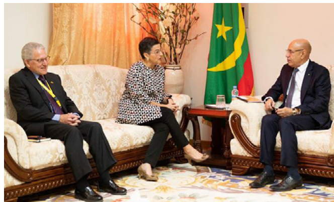
Encuentro entre el presidente de Mauritania, Mohamed Ould Ghazouani y la ministra de Asuntos Exteriores, Arancha González Laya, con motivo de su viaje a Mauritania.- 25 febrero 2020.

Al margen del mencionado MOU de Consultas Políticas, los últimos acuerdos firmados son un MoU en materia de Cooperación Agrícola, Desarrollo Rural y Ganadera (junio 2014), un MoU en materia de Cooperación Turística (enero 2015), la “Declaración de Intenciones para la Recuperación de especies extinguidas localmente” (marzo 2015), el Convenio de Cooperación en materia de Seguridad (mayo de 2015 que entró en vigor en mayo de 2018) y el Acuerdo relativo a la actividad remunerada de las personas dependientes del personal diplomático, consular, administrativo y técnico de las misiones diplomáticas y de las oficinas consulares (junio de 2017). Además, en marzo de 2016 entró en vigor el Acuerdo de Promoción y Protección Recíproca de Inversiones (APPRI), firmado por ambos países en el 2008.