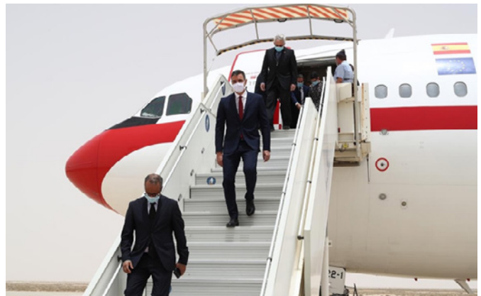
El presidente del Gobierno, Pedro Sánchez, a su llegada a la capital de Mauritania, Nuakchot (Mauritania) - 30/06/20.

La cooperación bilateral en materia de lucha contra la inmigración ilegal sigue siendo excelente, hecho que quedó reflejado en la reducción progresiva de llegadas de inmigrantes a las costas canarias, pasando de 31.678 en 2006 a 450 en 2017. No obstante, a partir del año 2018, se invirtió la tendencia y comenzaron a incrementarse las llegadas de inmigrantes a Canarias, con 1.291 en 2018 (+188% respecto al año 2017), 2.702 en 2019 (+109% respecto al año 2018) y 23.420 en 2020, la mayor parte durante el último trimestre (+866% respecto a 2019), mientras que en 2021 llegaron 22.853 inmigrantes, cifra ligeramente inferior a la del año anterior (-1,7%); . A estos datos se suma también el aumento en el número de interceptaciones de inmigrantes, llevadas a cabo por los países que forman la franja atlántica africana, entre ellos, en especial, Mauritania donde durante el año 2021, se han conocido un total de 436 actuaciones de las autoridades mauritanas, con interceptación de 128 cayucos y 9230 migrantes en territorio mauritano, sus fronteras terrestres, marítimas y aguas territoriales, incluidos organizadores u otros colaboradores, que supera en un 221% el total de inmigrantes llegados a Canarias desde las costas mauritanas.