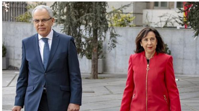
La ministra de Defensa, Margarita Robles, mantuvo un encuentro con el ministro delegado ante el jefe de Gobierno del Reino de Marruecos, encargado de la Defensa Nacional, Abdelatif Loudyi.- Madrid , 4 de marzo de 2019.- @Ministerio de Defensa