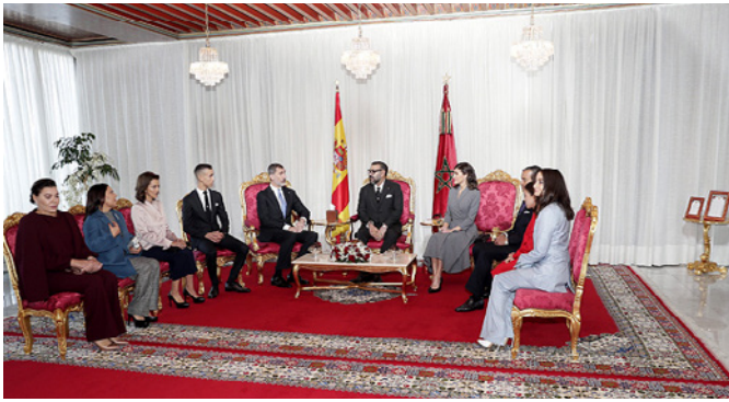
Miembros de la familia real marroquí con los Reyes de España en su visita de Estado a Marruecos.- Febrero 2019.- @ Fernando Junco