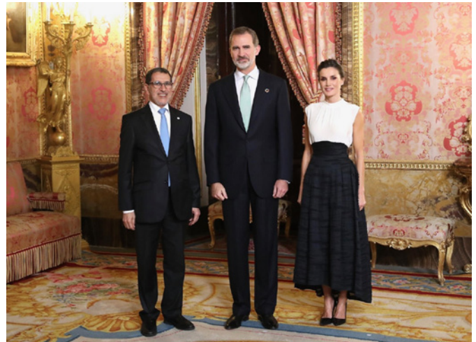
Sus Majestades los Reyes junto al anterior Excmo. Sr. Saadeddine Othmani, jefe del Gobierno de Marruecos, durante la recepción ofrecida por SS MM a los jefes de Estado, de Gobierno y de Delegaciones asistentes a la COP25.- Palacio Real de Madrid, 02/12/2019.

Además de todo lo relativo a los diferentes mecanismos de coordinación mencionados en los apartados anteriores, cabe destacar que la Oficina de Cooperación de Rabat sigue alimentando su página web de AECID en Marruecos http://www.aecid.ma/ . Esta web contiene información sobre los proyectos en curso y sus principales actividades, y contribuye a la difusión de los eventos más destacables, así como las ofertas de empleo, licitaciones y demás información de utilidad. La web está abierta asimismo a disposición de todos los actores de la cooperación española presentes en Marruecos.