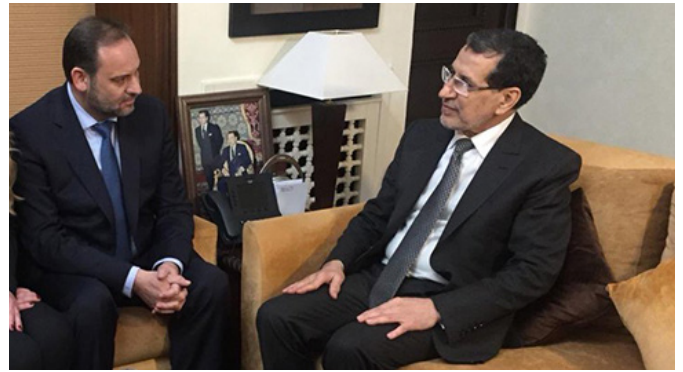
Encuentro en Rabat entre el anterior jefe del Gobierno Marroquí, Saad-Eddine El Othmani y el anterior ministro de Fomento, José Luis Ábalos, Rabat, enero 2019.