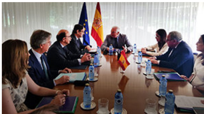
Reunión mantenida entre el anterior ministro de Asuntos Exteriores, Unión Europea y Cooperación, Josep Borrell en Rabat con los cónsules generales de España en Marruecos.- Junio 2019.

A la inversa, un 41% de las exportaciones marroquíes a la UE tuvieron como destino España.