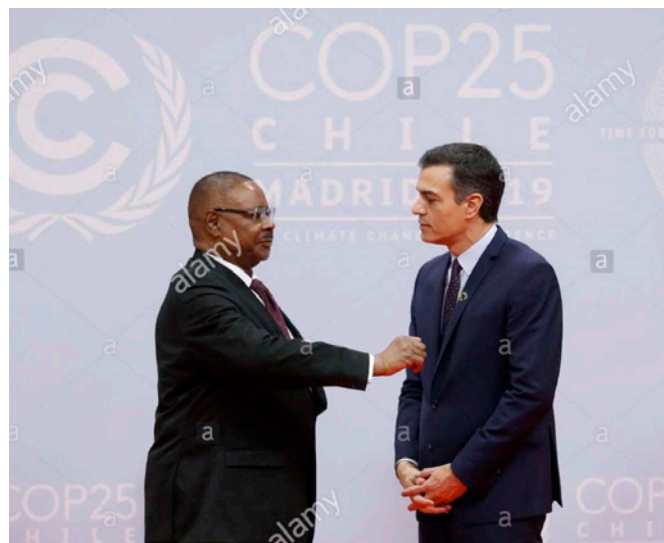
Encuentro entre el presidente de Gobierno en funciones, Pedro Sánchez y el anterior presidente de Malawi, Peter Mutharika a su llegada a la ceremonia de apertura de la Cumbre del Clima COP25 celebrada en Madrid el 2 de diciembre de 2019.

España está comprometida con el desarrollo del país africano a través de NN.UU., el PMA (Programa Mundial de Alimentos) y mediante el Fondo Europeo de Desarrollo (FED) de la Unión Europea, del cual España es el quinto contribuyente.