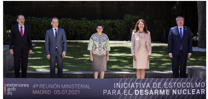
Reunión ministerial para fortalecer el Tratado de No Proliferación nuclear.- Madrid, 5 de julio de 2021.