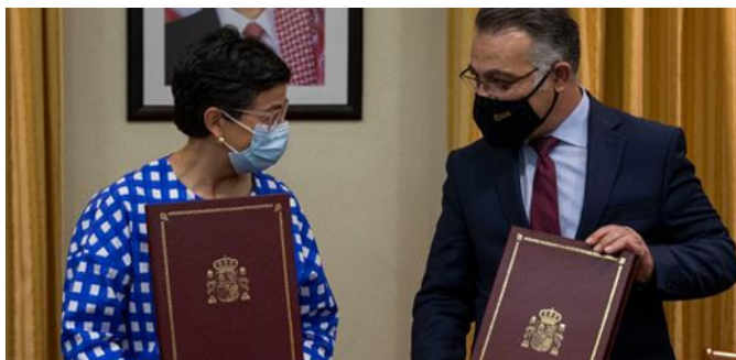
La anterior ministra de Asuntos Exteriores, Unión Europea y Cooperación, Arancha González Laya, junto al entonces ministro de Planificación y Cooperación jordano, Wissam Rabadi durante la firma del Marco de Asociación País entre los dos países.- Jordania 02/10/2020

En 2020 y 2021, el impacto socioeconómico producido por el bloqueo de las actividades económicas en Jordania debido a la pandemia de la COVID-19 ha sido severo, pues ha multiplicado los efectos negativos de la crisis económica ya existente y la presión sobre los servicios públicos de los refugiados provocada por la crisis siria. En el marco de la Estrategia de Respuesta Conjunta de la Cooperación española frente a la COVID-19, la OTC ha emprendido varias acciones de refuerzo de la capacidad de respuesta de Jordania a las nuevas necesidades. Entre ellas, cabe destacar una subvención al Ministerio de Salud jordano para el apoyo a la gestión descentralizada del sistema de salud pública de Jordania, para mejorar el acceso, la calidad de los servicios y la adaptación a los retos que plantea la COVID 19; la compra de materiales y equipos para limpieza y desinfección para la prevención de la COVID-19 en varios municipios de la Gobernación de Mafraq; y la contribución financiera al Fondo de Asistencia Social de Jordania.