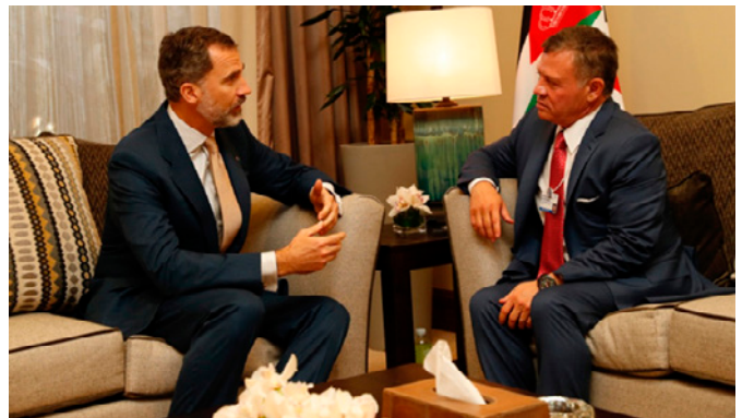
SM el rey de España junto con SM el rey de Jordania durante un encuentro mantenido en Amán en mayo de 2017.

Conforme a la Constitución, la Cámara baja es la responsable de controlar al Gobierno y de emitir el voto de investidura y, en su caso, los de confianza o censura. También le corresponde aprobar los proyectos de ley remitidos por el Ejecutivo. A la Cámara alta o Senado (los senadores son designados por el rey) le corresponde aprobar, enmendar o rechazar los proyectos de ley remitidos por la Cámara baja. Una vez superado el filtro del parlamento, el ejecutivo somete el proyecto de ley al rey para su sanción y publicación.