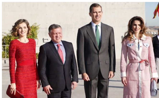
SSMM los reyes de España junto a SSMM los reyes del Reino Hachemita de Jordania tras su llegada a Madrid en Visita de Trabajo.-19/11/2015.

Ministro de Administración Local, Tawfiq Kreshan