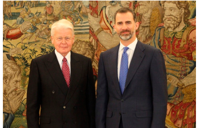
Su Majestad el Rey junto al entonces presidente de la República de Islandia, Ólafur Ragnar Grímsson, con motivo de su visita a España.- Palacio de La Zarzuela. Madrid, 17.02.2015.