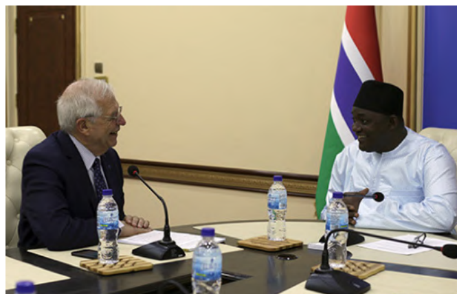
El entonces ministro Borrell fue recibido en Banjul por el presidente de Gambia, Adama Barrow.

Las relaciones políticas bilaterales con Gambia son correctas y no han sido demasiado intensas hasta fechas muy recientes. A partir de la crisis migratoria del 2006 se inició una serie de visitas de alto nivel, entre ellas la primera