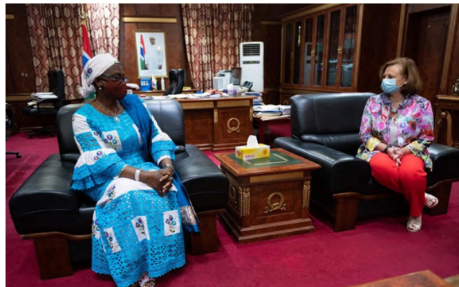
Encuentro entre la vicepresidenta de Gambia, Isatou Touray y la secretaria de Estado de Asuntos Exteriores y para Iberoamérica y el Caribe, Cristina Gallach, con motivo de su viaje a Gambia. Diciembre 2020 @ Foto: MAUC

Ministro de Juventud y Deporte: Bakary Badjie.