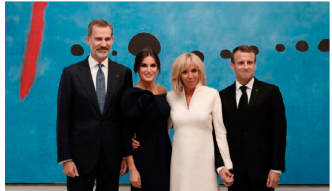
SS.MM los Reyes junto a SS.EE el presidente de la República Francesa, Emmanuel Macron, y la primera dama, Brigitte Macron. París, 5 de octubre de 2018.

22 y 23/09/2020: visita del ministro delegado encargo de Transportes, Sr. Jean-Baptiste Djebbari, al ministro de Transportes, Movilidad y Agenda Urbana, D. José Luis Ábalos.