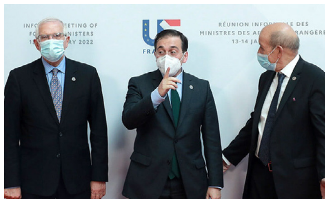
El ministro español Don José Manuel Albares junto a su homólogo francés, Don Jean-Yves Le Drian.-Brest (Francia), 13 de enero de 2022.

Canje de notas creando en Melles, en territorio francés, una oficina de controles nacionales yuxtapuestos (Firma: 15 de junio de 1978; en vigor: 15 de junio de 1978)