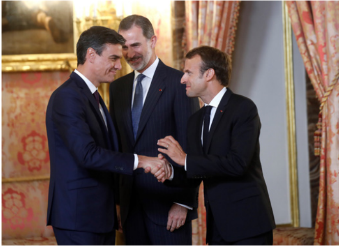
El presidente de Francia, Emmanuel Macron, junto al rey Felipe VI, saluda al presidente del Gobierno español, Pedro Sánchez, durante la reunión que mantuvieron el martes 26 de julio de 2018 en el Palacio Real de Madrid.