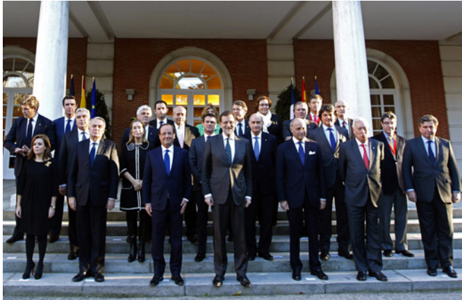
Foto de familia de la XXIII Cumbre hispano-francesa celebrada en Madrid, en noviembre de 2013.

05-10-2018. Viaje a París de SS MM los Reyes invitados por el presidente de la República francesa, para visitar la Exposición de Joan Miró en el Grand Palais.