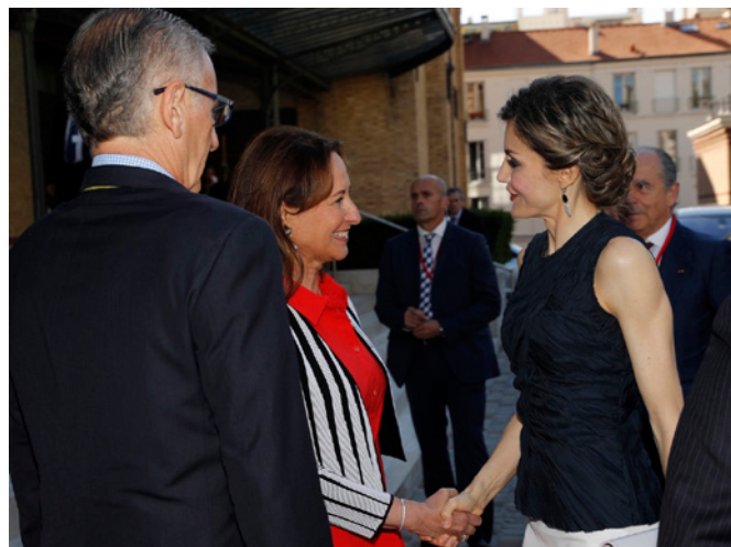
Encuentro de Su Majestad la Reina con la ministra de Medio Ambiente de la República Francesa, Ségolène Royal, y el secretario de Estado para el Desarrollo y la Francofonía de la República Francesa, André Vallini, en el Centro de Conferencias del Ministerio de Asuntos Exteriores. París, 07.07.2016.

Adrien Taquet, encargado de Infancia y familias