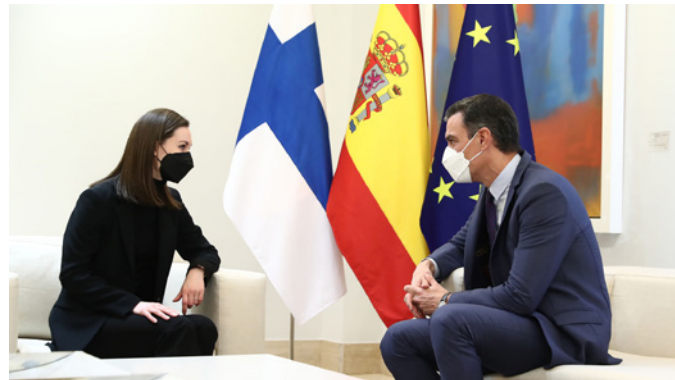
El presidente del gobierno español, Pedro Sánchez, junto a la primera ministra finlandesa, Sanna Marin.-Madrid (Palacio de la Moncloa), 26 de enero de 2022.

La relación de Finlandia con Rusia, país con el que mantiene intensos vínculos económicos, comerciales y de carácter transfronterizo, reviste enorme relevancia para el país. Tras la ocupación de la península de Crimea por parte de este país Finlandia ha seguido las líneas generales adoptadas en el seno de la UE, que incluye la adopción de sanciones.