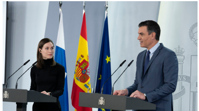
El presidente del Gobierno, Pedro Sánchez, se reúne con la primera ministra de la República de Finlandia, Sanna Marin, a quien ha recibido en La Moncloa. La Moncloa, Madrid 26.1.2022

En el Parlamento ha sido vicepresidenta de la comisión de Exteriores y es vice Secretaria General de su partido. Es economista con sendos masters en tecnología y finanzas, antes de entrar en política tuvo una exitosa carrera en el sector financiero, incluyendo puestos en el Royal Bank of Scotland y