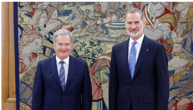
Su Majestad el Rey junto al Presidente de la República de Finlandia, Sauli Vainämö Niinistö. Palacio de La Zarzuela. Madrid, 29.06.2022.

negociación. Un buen reflejo de estos principios es el interés de Finlandia en participar en procesos de mediación internacional, siendo un referente para el país la figura del antiguo Presidente de Finlandia Martti Ahtisaari, galardonado con el Premio Nobel de la Paz en 2008. En ese sentido, actualmente Finlandia copreside junto a Turquía el Grupo de Amigos de la Mediación, establecido a iniciativa de estos dos países en conexión con la Asamblea General de Naciones Unidas de 2010. Además, atribuye mucha relevancia a otros ámbitos en el plano multilateral como el de “Mujeres, Paz y Seguridad”.