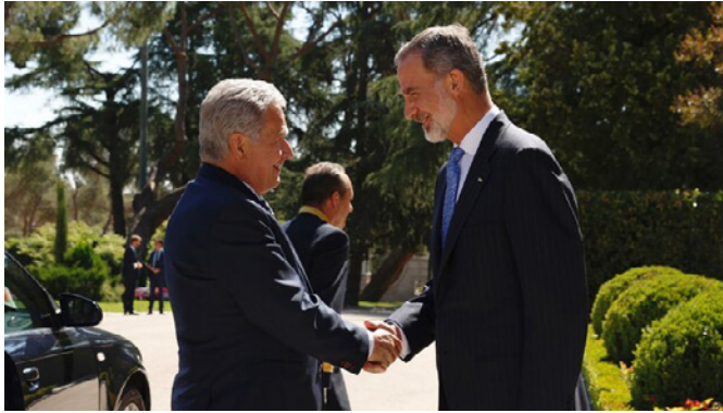
Su Majestad el Rey recibe el saludo del presidente de la República de Finlandia, Sauli Vainämö Niinistö, a su llegada al palacio de la zarzuela.-29/06/2022.

La inversión española en Finlandia fue de 4,7 millones de euros en 2021 y de 2,3 millones de euros en 2019. El sector protagonista es el de servicios de consultoría. El stock de inversiones españolas en Finlandia por cifra de negocio se situó en 350 millones de euros en 2021.