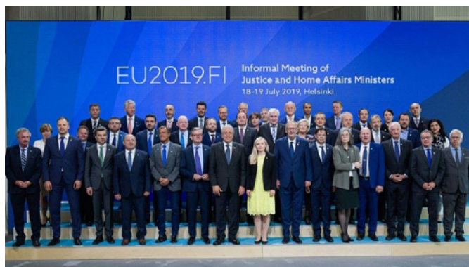
Grande-Marlaska, ministro de Interior, reunión con sus homólogos europeos en el Consejo de Justicia y Asuntos de Interior (JAI) de la Unión Europea, celebrada en Helsinki. 18 de julio 2019.