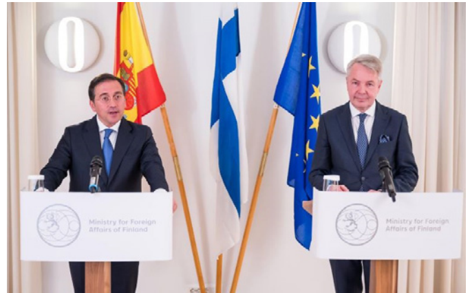
El ministro español del MAEUC, Albares junto a su homólogo finlandés Haavisto.-Helsinki 27/04/2022.

La Comisión Europea estima que el crecimiento real del PIB en 2023 será muy débil (0,2%) debido a la recesión leve que experimentó en la segunda mitad de 2022, aunque se recuperará para 2024 (1,4%). En cuanto a la inflación, la Comisión estima que será reducida para 2023 (4,8%) y posteriormente disminuida a menos de la mitad para 2024 (2,1%). El paro aumentará ligeramente en 2023 (7,1%) para posteriormente volver a un 6,8% en 2024. El déficit público aumentará ligeramente en 2023 (2,6%) y se mantendrá igual en 2024.