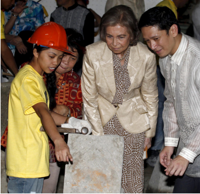
SM la Reina atiende a las explicaciones de una joven filipina, durante su visita a una escuela taller financiada por España en Manila, durante su visita en julio de 2012.