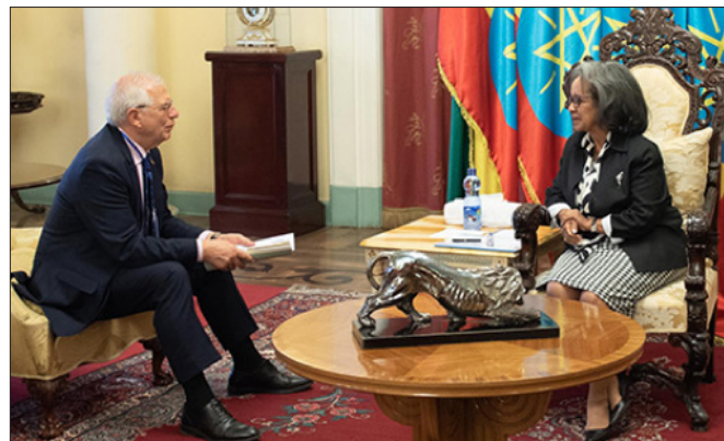
El entonces ministro de Asuntos Exteriores, Unión Europea y Cooperación, Josep Borrell, es recibido por la presidenta de Etiopía, Sahle-Work Zeude, En Addis Abeba.- 07/03/2019