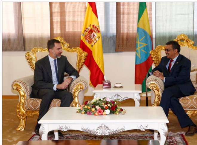
Encuentro de SM el Rey con el entonces ministro de Asuntos Exteriores de Etiopía, Tedros Adhanom Ghebreyesus, (Enero 2015).

Los ingresos en divisas de Etiopía están liderados por el sector de servicios, principalmente las aerolíneas estatales Ethiopian Airlines, seguido de las exportaciones de varios productos básicos. Si bien el café sigue siendo la principal fuente de divisas, Etiopía está diversificando las exportaciones y los productos básicos como el oro, el sésamo, el khat, la ganadería y los productos hortícolas son cada vez más importantes. La manufactura representó menos del 8% de las exportaciones totales en 2016, pero las exportaciones de manufactura deberían aumentar en los próximos años debido a una creciente presencia internacional.