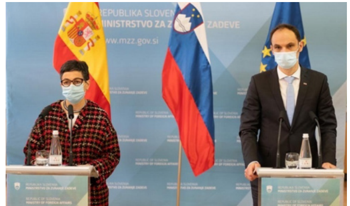
La anterior ministra Dña Arancha González Laya junto a su homólogo el ministro de Asuntos Exteriores Anže Logar.-Eslovenia 12 de marzo de 2021.