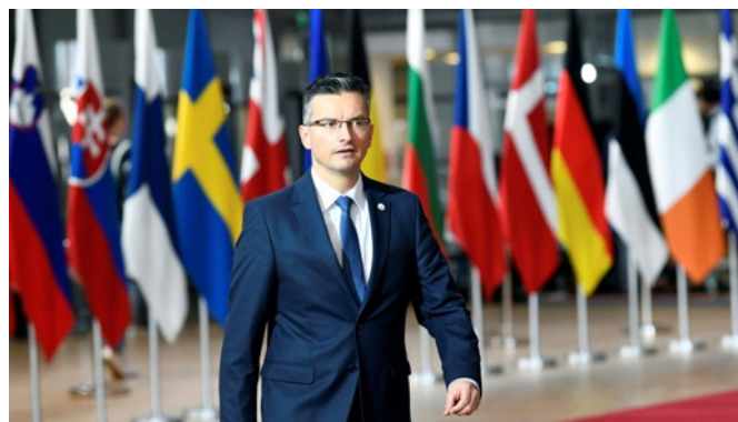
Participación del primer ministro esloveno, Marjan Šarec, en la Cumbre Europea celebrada en Barcelona.- Octubre 2019.-

En 2020 el PIB cayó un 5,5% debido a los efectos causados por la crisis del coronavirus. En el primer trimestre de 2021 el PIB creció un 1,6% en comparación con el mismo periodo de 2020. El Banco de Eslovenia ha publicado en junio de 2021 sus previsiones de crecimiento para la economía eslovena: 5,2% en 2021 y 4,8% en 2022. El IMAD (Instituto de Análisis Macroeconómico de Eslovenia) pronostica crecimientos de un 4,6% y un 4,4%.