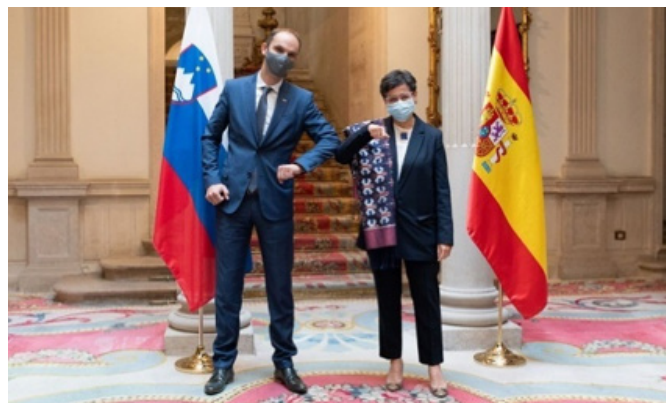
El ministro de Asuntos Exteriores Anže Logar junto a su anterior homóloga Dña Arancha González Laya.-Madrid (Palacio de Viana) 28 sept 2020.

Por ello, la Oficina Comercial de Viena, junto con ICEX, organizó en septiembre de 2019 una Misión Directa del sector de infraestructuras de ferrocarril