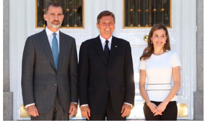
Sus Majestades los Reyes, con Su Excelencia el presidente de la República de Eslovenia, Sr. Borut Pahor. Madrid, 27 de junio de 2017

En el primer puesto se sitúan los aparatos y material eléctricos con un crecimiento del 32,2% (caída del 1,4% ref.2019). Los vehículos automóviles pasan a situarse en 2.ª posición, tras una disminución de un 40,6% respecto al mismo período de 2020 y un 48,3% respecto al de 2019. El origen de esta partida se encuentra principalmente en las operaciones de la planta de Renault de Novo Mesto. Por su parte, el capítulo de máquinas y aparatos mecánicos desciende a 4.ª posición, a pesar de aumentar consecutivamente