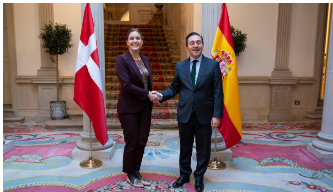
El Ministro de Asuntos Exteriores español, José Manuel Albares, junto con la Ministra de Asuntos Europeos de Dinamarca, Marie Bjerre, Madrid, 6 de febrero de 2025

junto con un amplio estado del bienestar. La ausencia de mayorías políticas se traduce en políticas sociales, energéticas, económicas, educativas y de política exterior con perfil continuista, no influenciadas por el grado de estabilidad del gobierno.