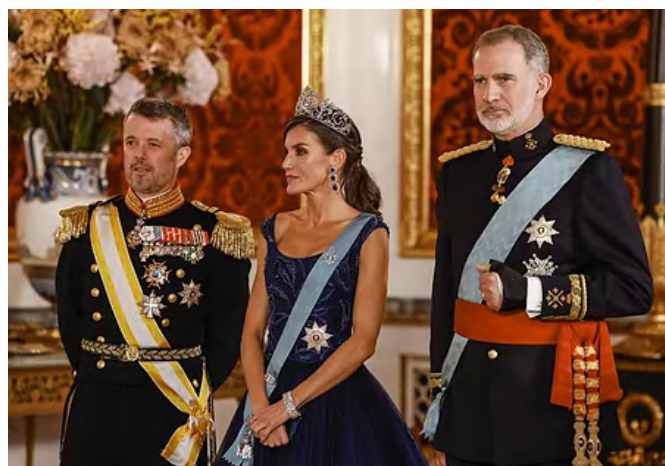
Los reyes de España posan junto al príncipe Federico, a su llegada a la cena de gala ofrecida en el Palacio de Christiansborg, en Copenhague.-7/11/2023.-foto © EFE

Copenhague es sede de oficinas de varios OOH: Agencia Europea de Medio Ambiente, Oficina Regional de la OMS, Oficina Europea de Radiocomunicaciones, servicios de compras de PNUD y UNICEF, EUROFISH, Consejo