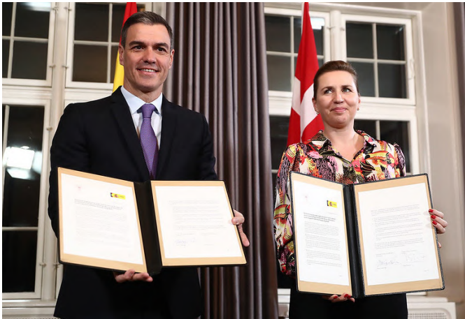
El presidente de Gobierno, Pedro Sánchez, y la primera ministra del Reino de Dinamarca, Mette Frederiksen, tras la firma de un memorando de entendimiento sobre energías renovables. Dinamarca 2/3/2023.

29 a 31 octubre 2024. La Ministra de Sanidad, Mónica García, visita Copenhague para participar en el Comité Regional para Europa de la OMS.