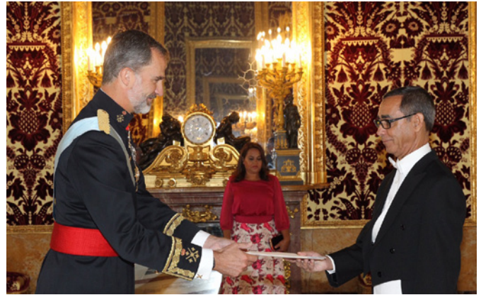
Entrega de cartas credenciales ante S.M el Rey D. Felipe VI del embajador de Cabo Verde en España, Excmo. Sr. Manuel Ney Monteiro Cardoso. 20 de septiembre 2017

Por todo ello, La Unión Europea sigue siendo un socio fundamental para Cabo Verde. El Partenariado Especial ha incrementado el diálogo político de forma notable en el marco de su 10º aniversario celebrado en 2018, refor-